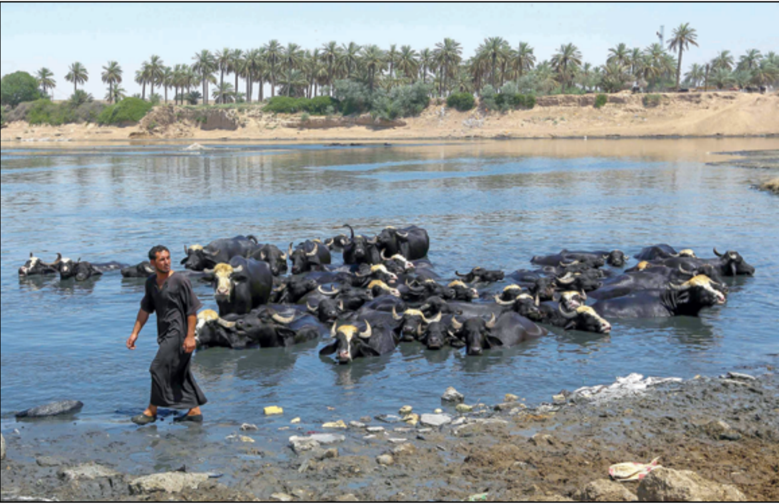
شحة المياه تهدد الثروة الحيوانية.. عسدة: محمود رؤوف