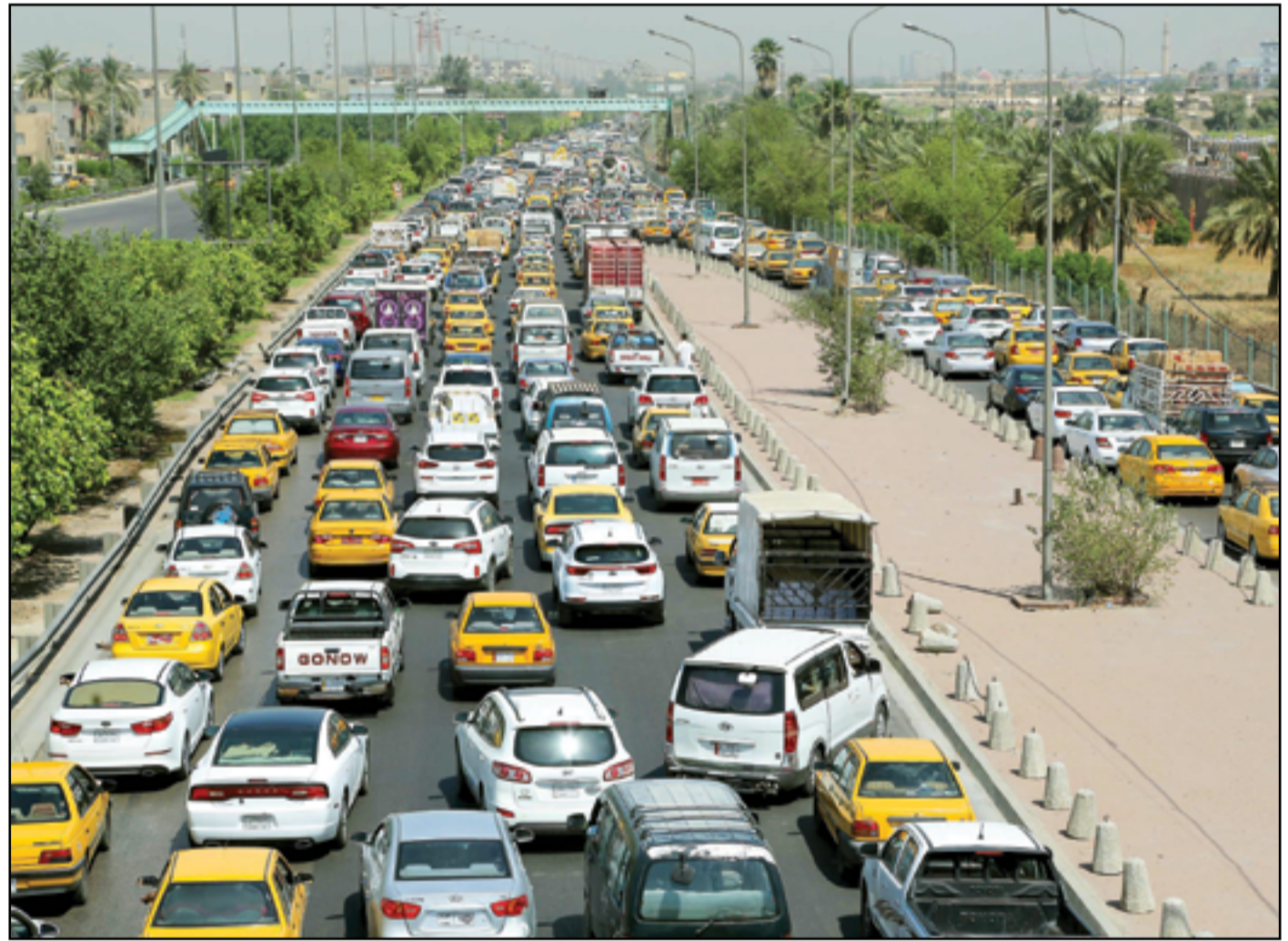
الاحتقاقات المرورية تشل الحركة في بغداد...

انتقلت حملة المليون شجرة في ديالى للتشجير، بهدف إعادة توطين أحد عشر نوعا من الأشجار المحلية، وذلك من أجل خلق توازن بيئي وانشاء المصدات الطبيعية. وقال عضو حملة المليون شجرة عدي الريعي في حديث ل(المدى)، إن الحملة تهدف الى إعادة توطين أحد عشر نوعا من الأشجار المحلية التي تدخل ضمن التراث النباتي في البلاد. مشيرا الى، ان هذه الأشجار