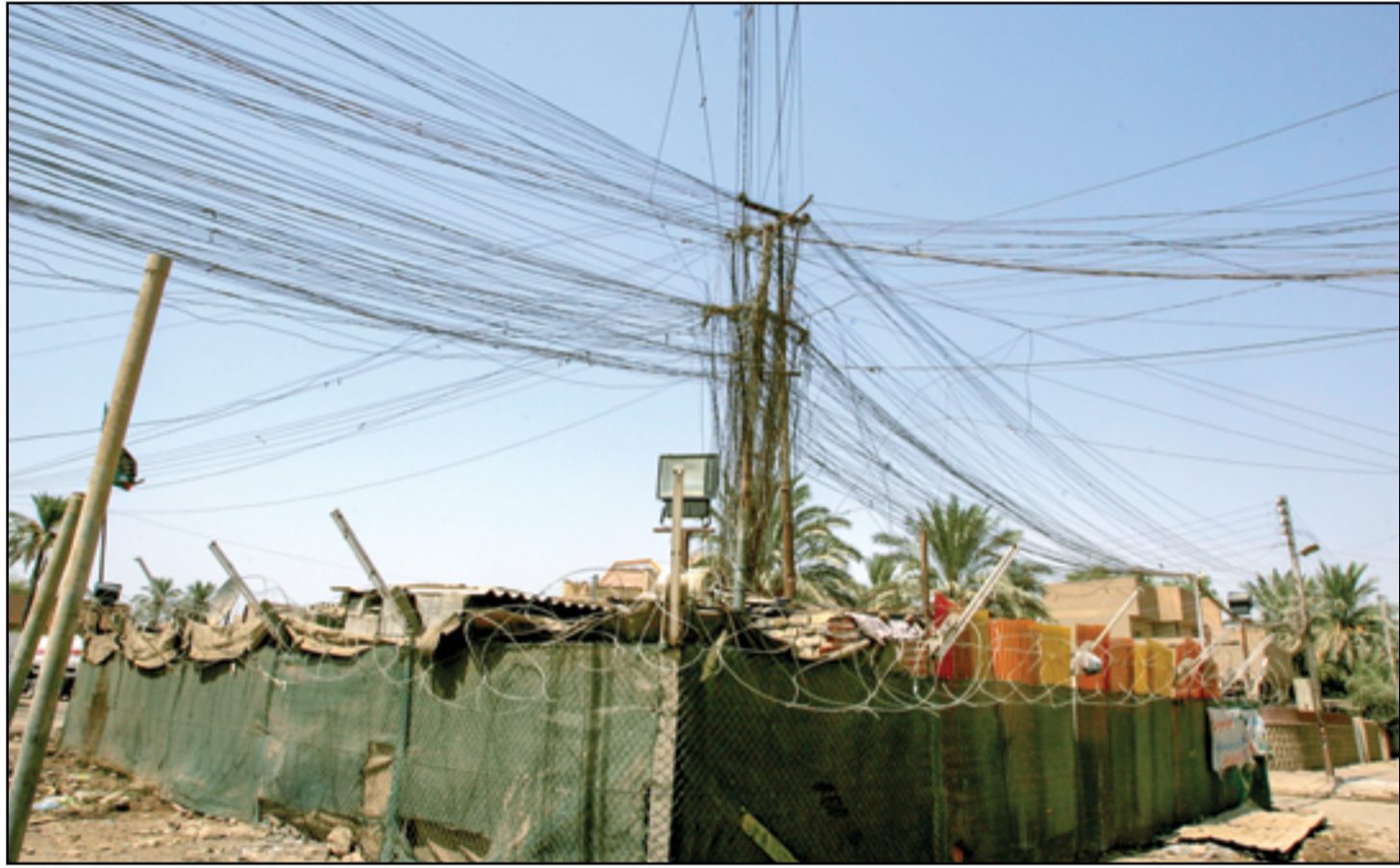
جشع أصحاب المولدات يفاقم معاناة المواطنين..

وأغلب الوزارات رواتبها متدنية لاسيما أصحاب الدرجات من العاشرة وصولاً إلى الخامسة. وأشار الكاظمي إلى، أن "السلم الجديد اعطى زيادة في الراتب الاسمي"، مستدركاً إن "مقترح السلم الجديد اكتمل تقريباً وقدم إلى الحكومة لغرض العمل به في العام 2023". وجدد تأكيد على أن "الملف بيد الحكومة ولا دخل للبرلمان واللجنة المالية به.. السلم الجديد يطبق