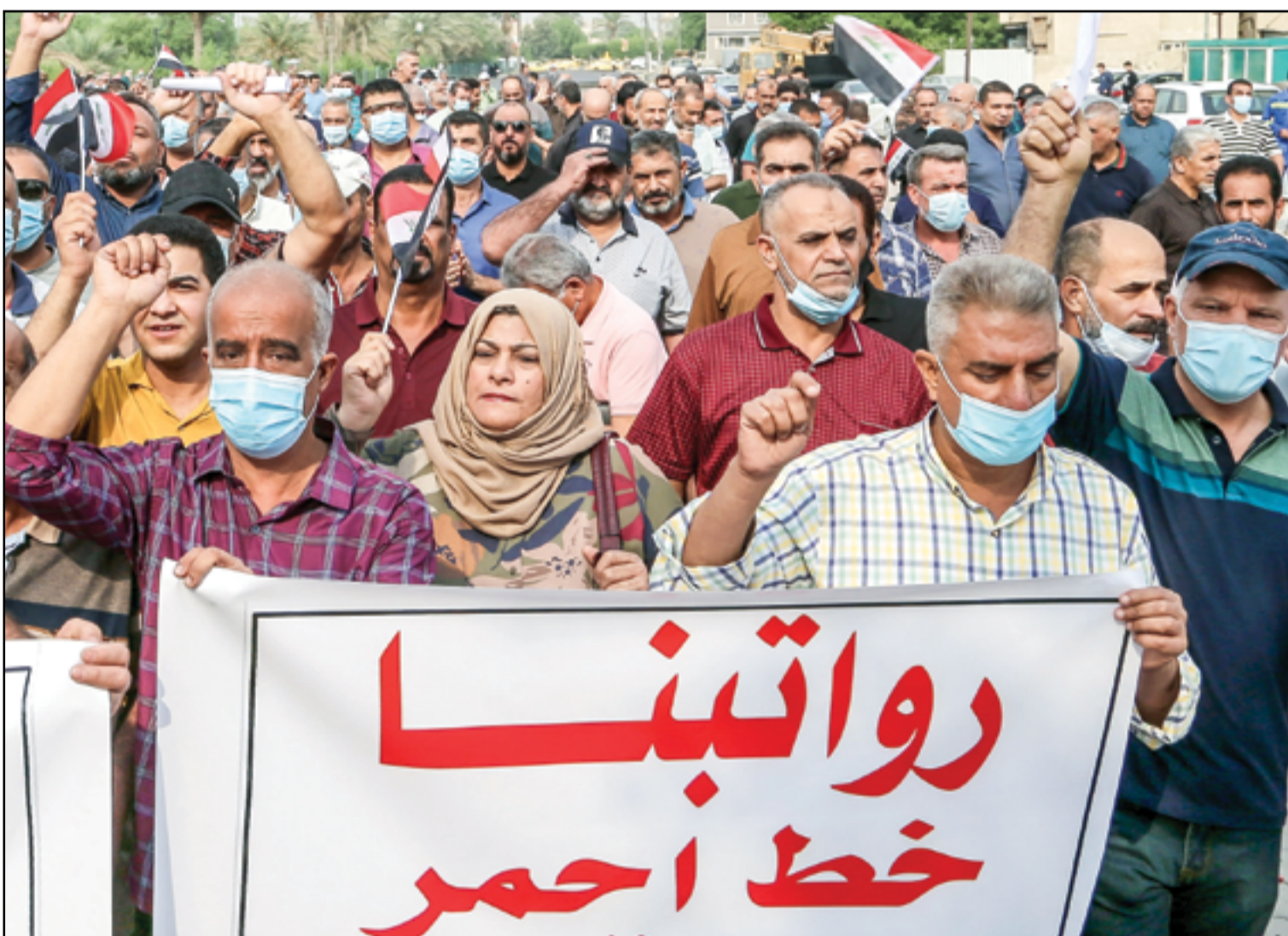
تظاهرة أمام وزارة التخطيط لموظفي الدولة تطلب تعديل سلم الرواتب..