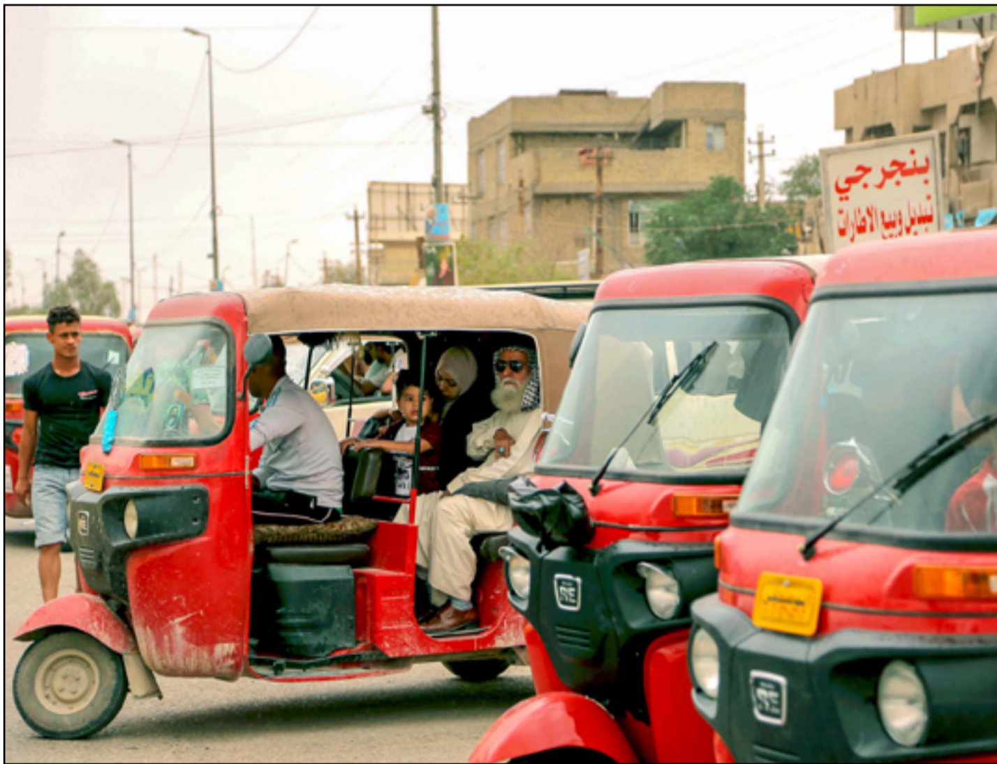
انتشار التكاك في بغداد...