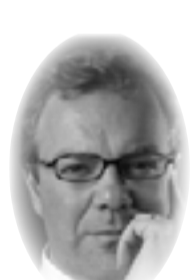
داميان شيلبير ترجمة: عدوية الهلالي

للكائن الحي، وكل كائن حي له غرض داخلي. وعندما يتحقق النمو، يتحقق هذا الهدف الداخلي. ومع ذلك، هناك بعد غائي في الوجود الإنساني. بل إن هناك مجموعة من الغايات التي يمكن تحديد أولوياتها: الحفاظ على الحياة، والسعادة، والحرية، والعدالة. وهذا أيضا ما نسميه السلع الأساسية.