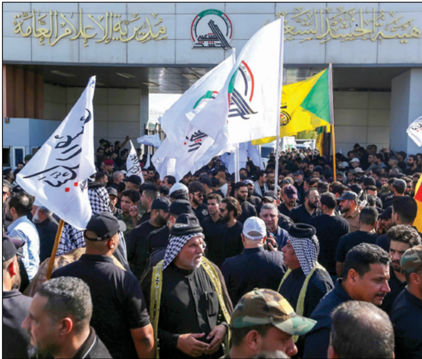
جانب من التشييع الذي أقامته هيئة الحشد الشعبي أمس في بغداد...