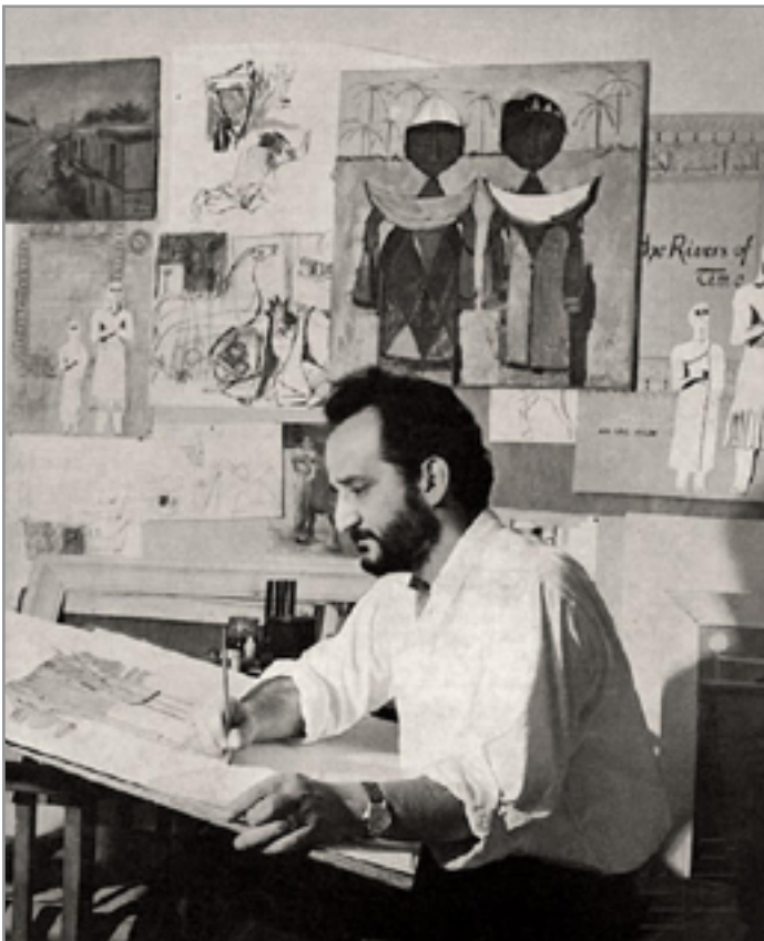
جواد سليم في مرسمه

معه إلى دار جواد، ودار الحديث بينهما؛ قال له: لقد طلب مني عبد الكريم قاسم تصميم نصب لثورة 14 تموز، وسيكون النصب في بداية حديقة الملك غازي سابقاً التي سميت بساحة التحرير. وسأجهز لك المكان الذي يوضع فيه النصب، والموضوع سيكون عن: ما قبل الثورة، والثورة وما بعد الثورة. وسيكون لافتة بخمسين متراً، تخمس جواد جيداً للفكرة، وأجاب رفعة: إنه لم ينجح نصب بهذا الحجم منذ زمن الأشوريين. بعد مدة قليلة سافر جواد وعائلته إلى فلورنيس في إيطاليا ليقيم في تنفيذ النصب،