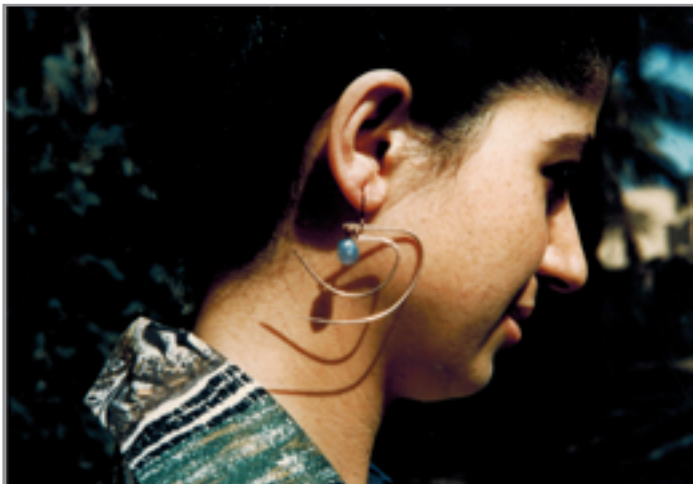
بليقس باقرات جواد سليم عام 1957، تصوير رفعة الجادرجي

وفي عام 1959، سافرننا إلى إيطاليا، وزرنا فلورنيس، وكان جواد في تلك الفترة، يعاني من أزمة نفسية أدت به إلى دخول المستشفى. فذهبنا مع لورنا إلى المستشفى، وفوجيء جواد بزياتنا له، وتكفله رفعة وأخرجه من المستشفى. والتقينا مرات عديدة في فلورنيس، وكان جواد يأخذنا للمطاعم التي لا يهتمها السواح، وكان أصحاب المطاعم يرحبون به. والتقينا آنذاك بالنحات محمد غني الذي كان يدرس في روما النحت، لكنه جاء إلى فلورنيس لمساعدة جواد في النصب. عاد جواد بعد أن أنهى النصب، وصلت