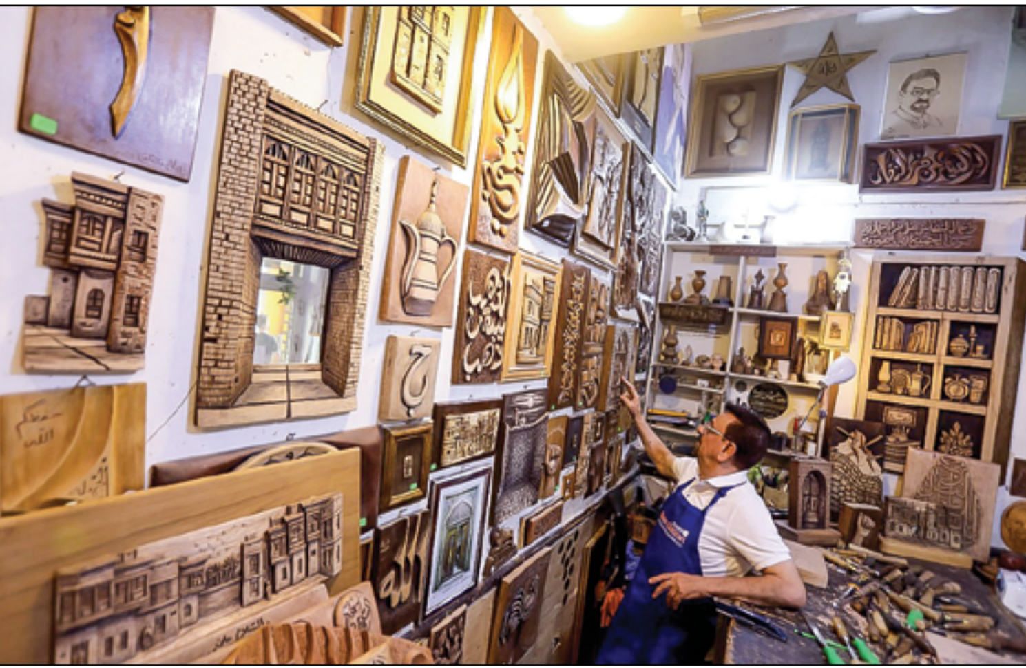
لوحات فنية تتحدث بلغة الخشب...