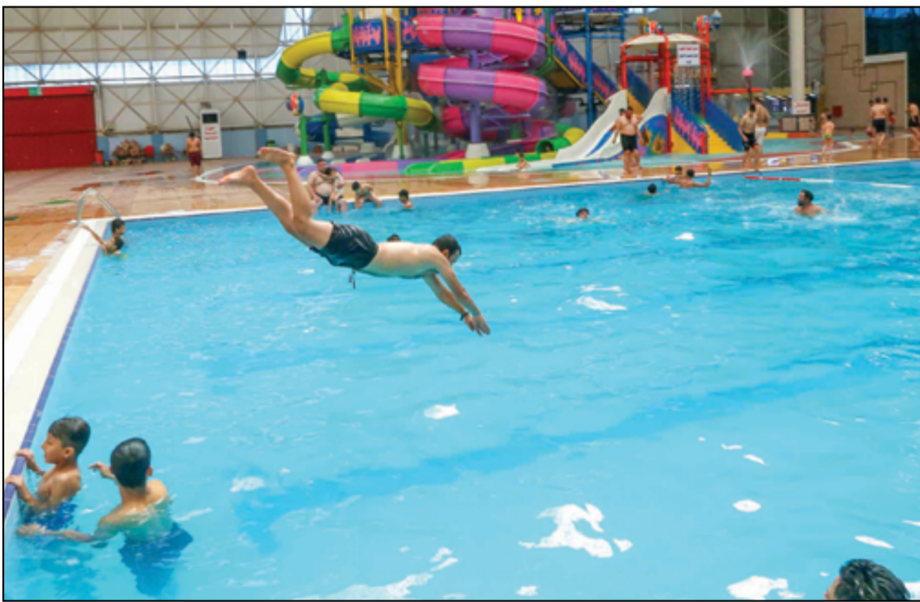
شباب يهرون من حر الصيف...