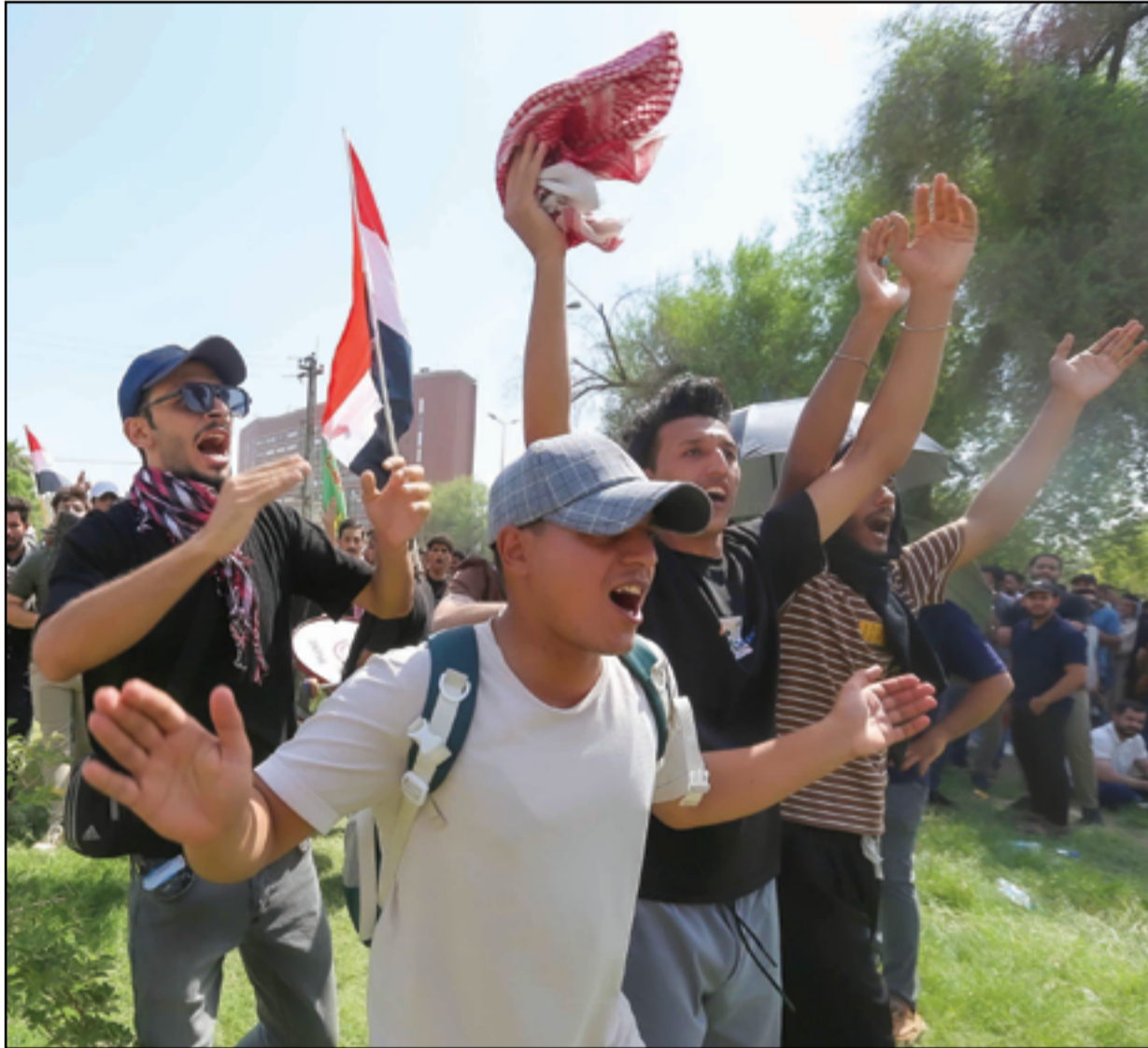
أثناء حكومية عن تعيين حوالي 30 ألف خريج من المهن الصحية.. عداة: محمود رؤوف

وقال البنك في بيان إن "المنصة الإلكترونية للتحويلات الخارجية التي يديرها البنك المركزي العراقي بدأت في بداية عام 2023م كمرحلة أولى لإعادة تنظيم التحويلات المالية بما يؤمن الرقابة الاستباقية عليها بدلاً من الرقابة اللاحقة من خلال قيام الاحتياطي الفيدرالي بتدقيق الحوالات اليومية، وكان ذلك إجراءً استثنائياً إذ لا يتولى الفيدرالي عادة القيام بذلك، وجرى التخطيط للتحويل التدريجي نحو بناء علاقات مباشرة بين المصارف في العراق والبنوك الخارجية المراسلة والمعتمدة، وتتوسط ذلك شركة تدقيق دولية للقيام