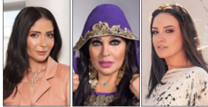
الفنانة ريهام عبد الغفور إلى موسم دراما وبعد غياب عام واحد فقط، منذ مسلسل "شيد" الذي عُرض عام ٢٠٢٣، تعود التحضيرات كاملة.

تُعد الفنانة فيفي عبده، من أبرز العائدات إلى الشاشة، بعد غياب تجاوز العامين، منذ مسلسل "شغل في العلي" الذي عُرض عام ٢٠٢٢، حيث تعاقدت للمشاركة في الجزء الثاني من مسلسل "العتولة"، ومن المقرر انطلاق التصوير في شهر تشرين الاول المقبل.