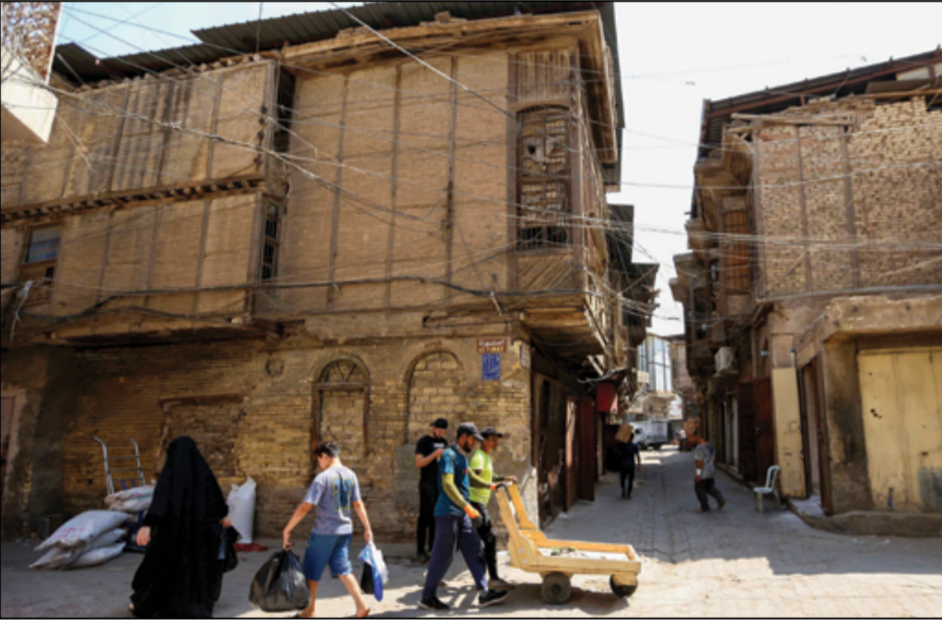
محلات بغداد التراثية تعاني من الإهمال..

ظهر محمد السوداني رئيس الحكومة وفائق زيدان رئيس القضاء وهما يبتسمان في الصورة التي نشرها مكتب رئيس الوزراء في أحدث لقاء جرى بين الطرفين مساء