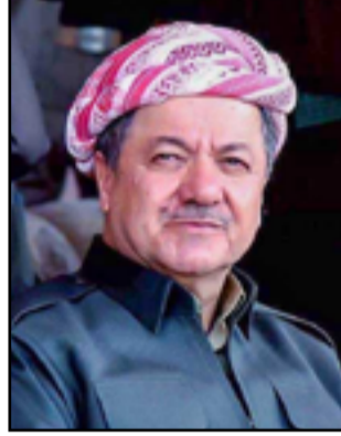
وأكد الوفد الضيف، بحسب البيان، أن لقاءاتهم واجتماعاتهم مع حكومة الإقليم كانت مثمرة، مشيدين على السعي للتوصل إلى تفاهم كامل في أجواء مليئة

بالتفة ومن خلال رؤية شافية وبناءة من أجل حل المشاكل العالقة وتجاوز العقبات. ولفت البيان إلى أن "أعضاء الوفد الضيف أعربوا خلال اللقاء عن سعادتهم بزيارة إقليم كردستان، مشيدين بالدور التاريخي للرئيس بارزاني في بناء العراق الجديد والنضال ضد الدكتاتورية، كما استعرضوا للرئيس بارزاني أهداف زيارتهم إلى إقليم كردستان ومباحثاتهم مع الجهات ذات الصلة في حكومة الإقليم.