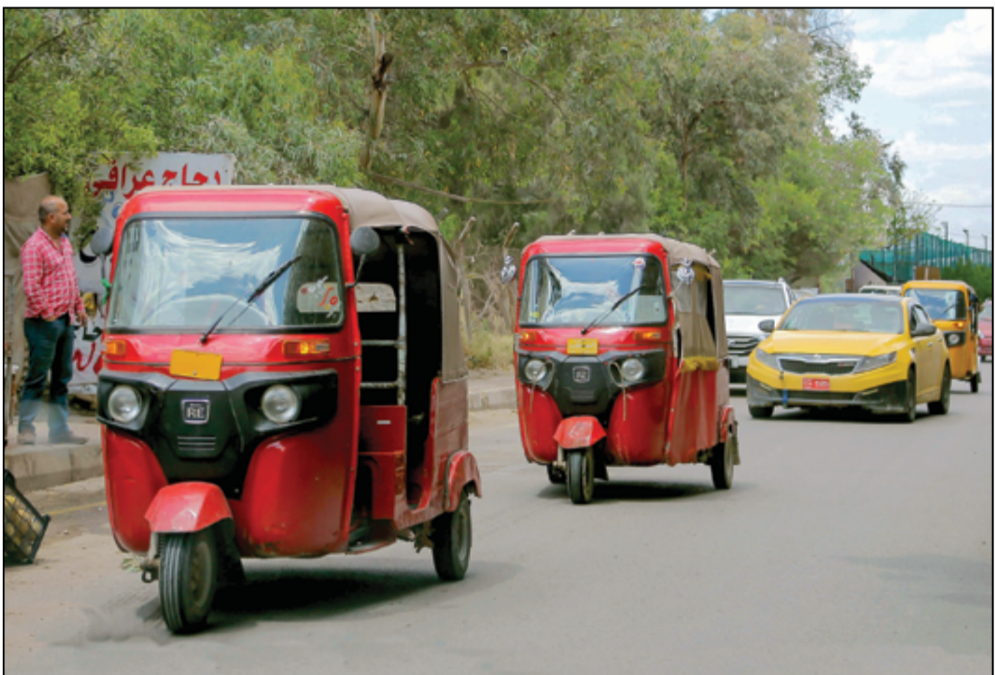
المرور تصدر قراراً بمنع سير التوك توك وسط العاصمة..