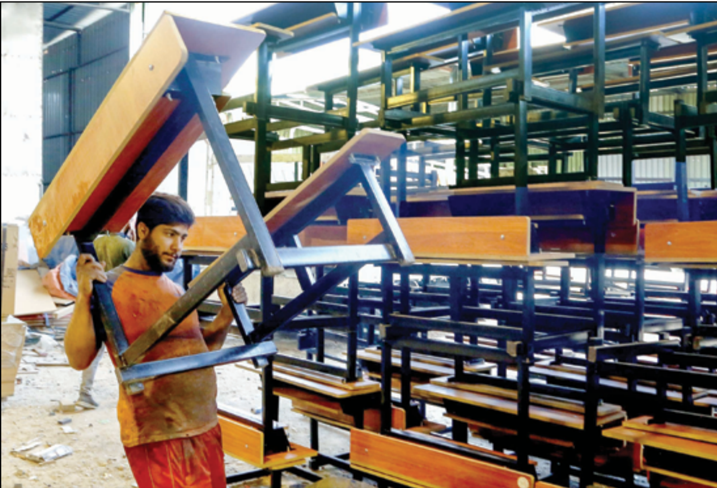
ورشة لانتاج المقاعد المدرسية مع بدء العام الدراسي...

شيخان - لالش في محافظة دهوك، أكد أن الانتهاء من هذا المشروع، بالإضافة إلى مشروع طريق (باعدة - ابيت) الذي أرسى الحجر الأساس له في شهر حزيران الماضي، "سيشكلان نقلة نوعية في قطاع النقل بالمنطقة". مسرور بارزاني شدد على أهمية هذا المشروع لـ "خدمة آلاف الزوار الذين يتوافدون سنوياً إلى معبد لالش المقدس"، مبيّناً أن الطريق الجديد "سيسهل حركتهم ويقلل من معاناتهم". ولفت إلى أن هذه المنطقة "تمثل نموذجاً يحتذى به في التعايش السلمي والتسامح بين مختلف المكونات في كردستان"، مؤكداً التزام حكومة إقليم كردستان بـ "خدمة هذه المنطقة وتوفير كافة الاحتياجات اللازمة لسكانها".