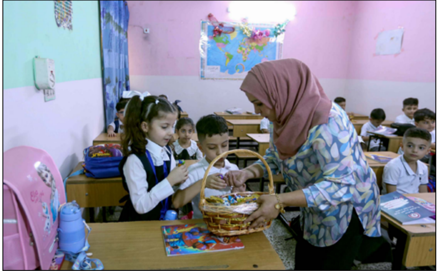
بدء العام الدراسي الجديد في بغداد.. عسة: محمود رؤوف

أعلن جهاز الأمن الوطني العراقي، أمس الأحد، عن إلقاء القبض على متهمة اثنتين تورطاً في ممارسة أعمال السحر والشعوذة وابتزاز أكثر من 400 ضحية في بغداد. وأوضح الجهاز في بيان له، أن العملية تمت بعد ورود معلومات استخباراتية دقيقة، واستحصال الموافقات القضائية اللازمة، حيث تمكنت مفرزات الجهاز من إلقاء القبض على المتهمة وهما متلبسان بحيازة العديد