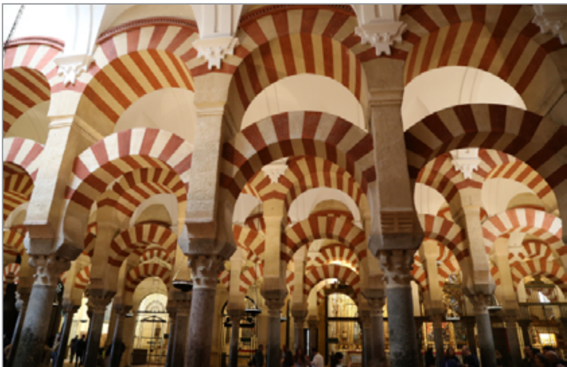
مسجد قرطبة الكبير، (786 - 987 م). قرطبة، اسبانيا، منظور داخل الظلة

يؤدي عنصر "الصحن" دوراً أساسياً في التكوين التصميمي - الفضائي/ الفني لعمارة مسجد قرطبة. فهو بمساحته ذات الأبعاد الواسعة وهندسته الصافية، وفضائه الخالي تقريباً من عناصر تصميمية (عدا الميضأة)؛ ومن ثم أحاطته من جميع الجهات باروقة مسقفة، وأسلوب توقيعه، ضمن المخطط العام للمسجد، فضلاً عن وظائفه المتنوعة، فإنه يعتبر أحد العناصر الرئيسيين (العنصر الآخر هو فضاء الحرم) المشكلين لهيئة التكوين العام لمبنى المسجد. وبهذه الماكثة التصميمية، فهو يؤدي دوراً تكوينياً مكافئاً ومعادلاً مع عنصر فضاء حرم المسجد، كما أن مفردة تجسد المفهوم الخاص لإيراد معنى "الفضاء"، وعلاقته بالكتلة المعمارية، الذي لهما علاقة بالمتناقضات (Plexity and Contradiction in Architecture, P. 23)؛ والذي يشمل المستويات المتناقضة من حيث المعنى، وفي العمارة المتناقض ذاتياً. إن طبيعة توقيع الصحن في المخطط التركيبي لمبنى مسجد قرطبة، وكذلك هيئته العامة، لا تسهم في تحديد مسارات الحركة بين كتل المبنى، وفراغاتها المصممة، ولا إلى تنظيمها. بل إن هيئة الصحن وشكله ذات "الغورمات" الهندسية المنتظمة، والمحاطة من جميع الجهات بعناصر تصميمية متشابهة ومتماثلة؛ لا تسعى حتى لتأشير اتجاهية المسار أو تحديده. فمنهج المسارات المحددة ذات الاتجاهية الاستدلالية تخفي عن أساليب المعالجات التصميمية للعمارة المساجدية، فضحى أرضية الصحن المشكوف وفناؤه الفسيح مجالاً مشاعاً لنوعية حركة حرة وطليقة وتلقائية، غير خاضعة لقيود ما. من هنا، يكتسب حضور "منافذ" الدخول المتعددة (و التركيز هنا على مفهوم "الداخل")