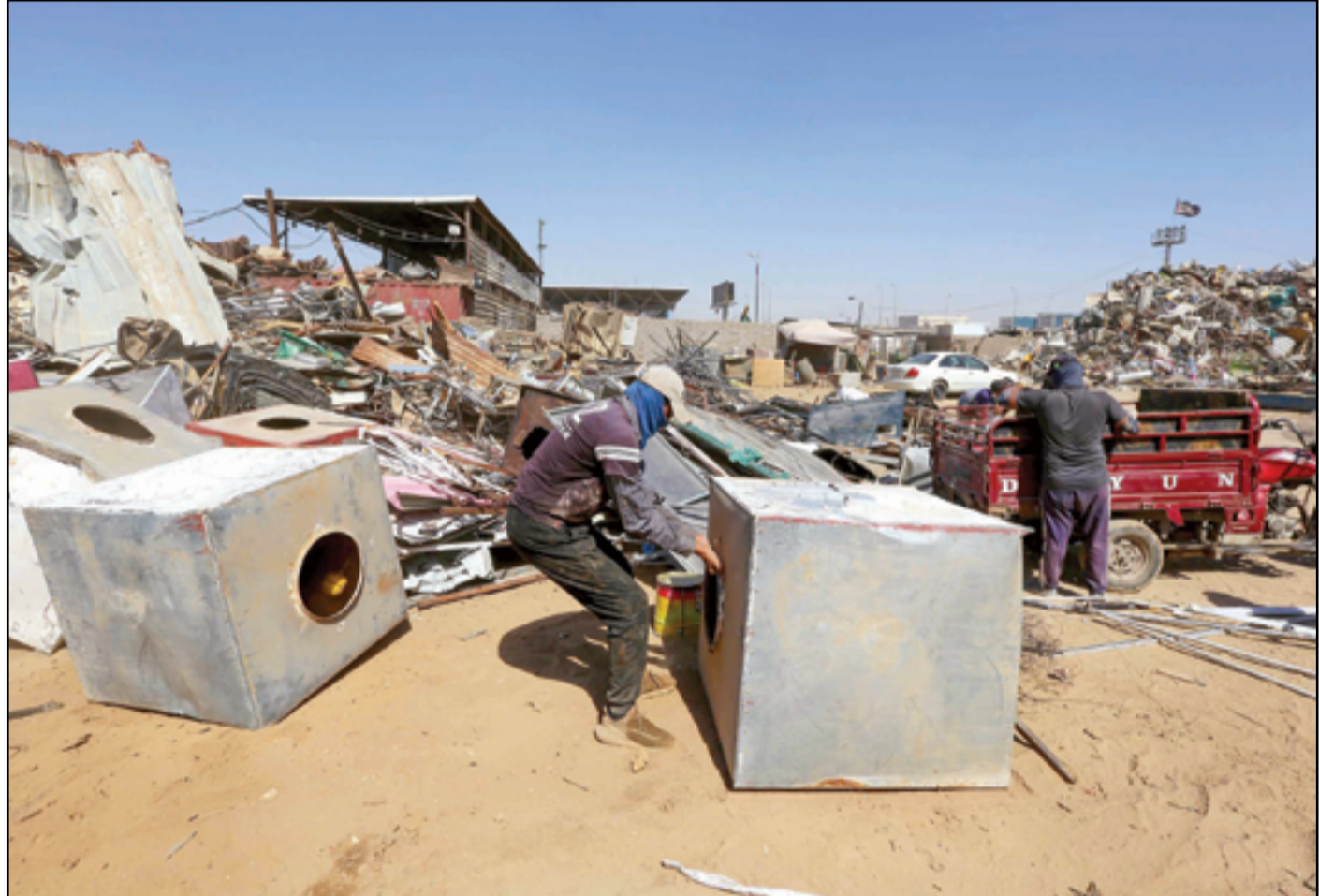
شباب يعملون في جمع السكرباء...

في إطار التفاهات المستمرة بين بغداد وأربيل، وصل رئيس اللجنة المالية النيابية، عطوان العطاوي، أمس الأربعاء، إلى إقليم كردستان لمناقشة عدد من الملفات المهمة. وتباحث العطاوي، فور وصوله ولقائه برئيس الحزب الديمقراطي الكردستاني، مسعود بارزاني، في تنفيذ أحكام قانون الموازنة العامة الاتحادية، وملف النفط والثروات الوطنية، وتوظيف رواتب الموظفين، والمنافذ الحدودية، والضرائب والجمارك. وذكر المكتب الإعلامي لرئيس اللجنة المالية، في بيان تلقته (المدى)، أن «عطوان العطاوي والوفد المرافق له التقوا برئيس الحزب الديمقراطي الكردستاني، مسعود بارزاني، في أربيل، حيث تطرق اللقاء إلى مجمل الأوضاع السياسية والأمنية في البلاد، وسبل حلحلة القضايا العالقة بين الحكومة المركزية وحكومة إقليم كردستان، بما يؤسس لمرحلة جديدة من التعاون والتنسيق والتفاهم على أساس احترام الدستور العراقي». واستعرض العطاوي الملفات التي جاء وفد اللجنة المالية لمناقشتها مع حكومة إقليم كردستان، وأوضح أن الملفات تتعلق بتطبيق أحكام قانون الموازنة العامة الاتحادية، بالإضافة