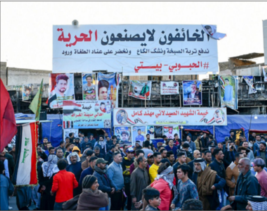
دفع تربة الصبغة ونشك الكاع ونخضر على عناد الطغاة ورود