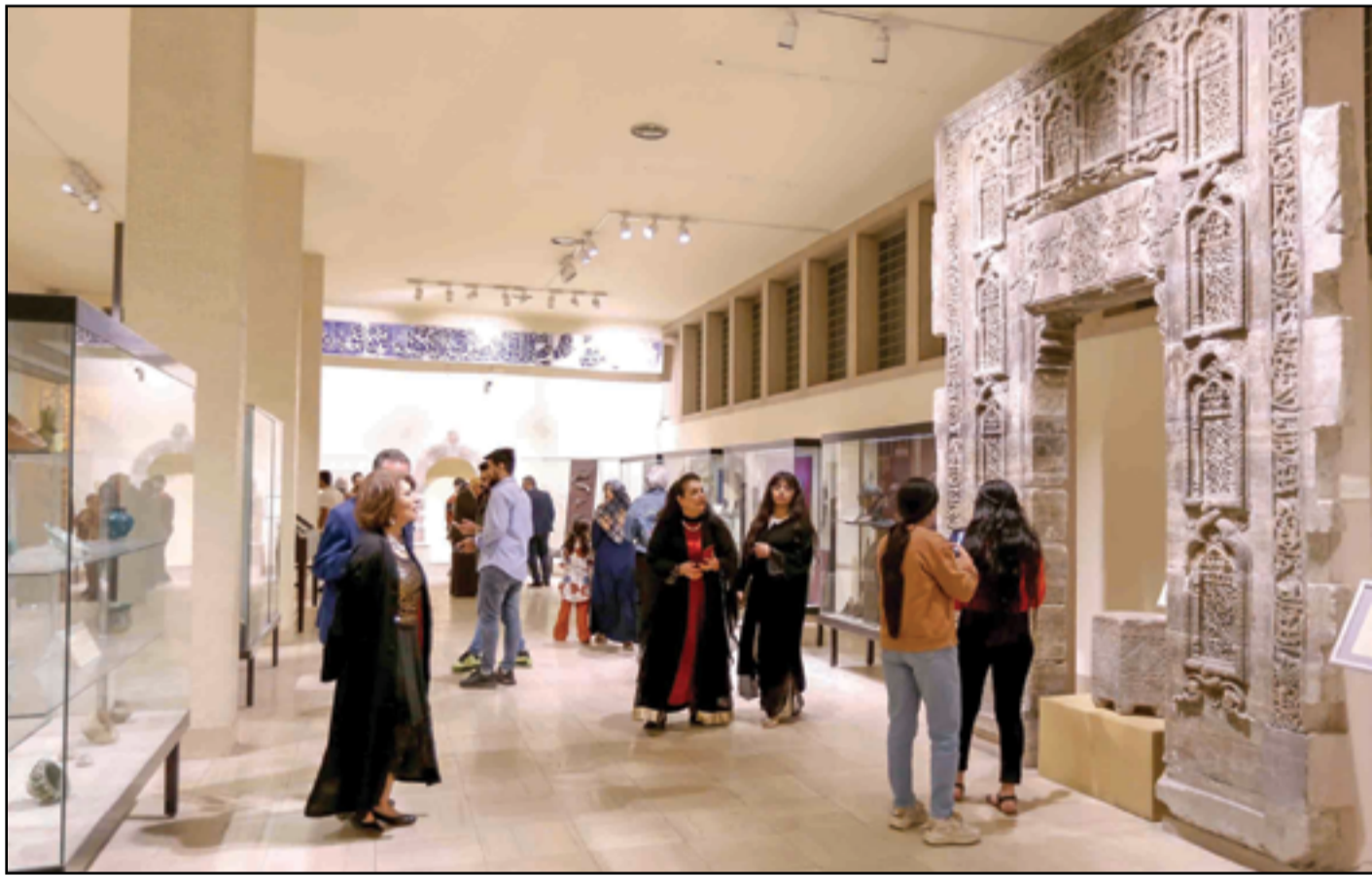
إقبال يومي على المتحف العراقي...

أكد رئيس حكومة إقليم كردستان، مسرور بارزاني، وجود علاقات جيدة مع الحكومة الاتحادية والسعي لتحسينها عبر توجه مشترك مع قرب معالجة مشكلة الرواتب جزئياً، مشيراً في الوقت ذاته إلى عدم انخراط الإقليم في أي صراع وهذا ينبثق من إيماننا العميق بعدم الانجرار إلى حروب المنطقة، فالقتال ليس وسيلة لحل الخلافات، ونحن نسعى لحماية كردستان وأن لا نكون منطلق تهديد أو خطر على أحد والعكس صحيح". وقال مسرور بارزاني في مقابلة تلفزيونية إن الانتخابات المقبلة حاسمة وتأتي في وقت حساس، لذا على الناخب وضع مستقبل كيان إقليم كردستان نصب