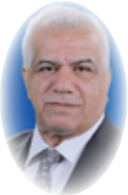
د. حسين الهنداوي

صمدق بتمكّن الشيوعيين من الاستيلاء على السلطة في البلاد، وبال دعوة الى مقاطعة عالمية للنفط الإيراني، كما قامت بحشد قواتها العسكرية مهددة باحتلال مصفى عبادان النفطية التي بناها البريطانيون، وكانت الأكبر في العالم آنذاك. وامام اصرار حكومة مصدق على تأميم النفط الإيراني، اتفق رئيس الوزراء البريطاني ونستون تشرشل مع الرئيس الأمريكي أيزنهاور على الإطاحة بحكومة مصدق بانقلاب عسكري تم في عام 1953، بالاعتماد التام على الدعم الأمريكي المباشر في عملية اطلاق عليها الأمريكيون اسم "أجاكس" (Ajax)، والبريطانيون "التمهيد" (Boot) ونفذت بإشراف مباشر من صديق حسين الانطباع جمعي أن طهران قد خرجت عن السيطرة وأن حكومة مصدق لم تعد قادرة على التحكم في الوضع، نجحت