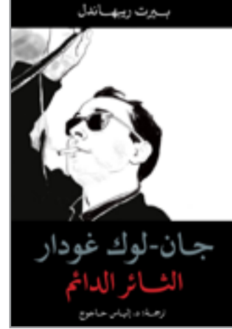
جان لوك غودار الناثر الدائم

أن يكون فنان أو صحفي أو أكاديمي أو فيلسوف ثورياً اليوم؟ إن مثل هذا اللقب يتطلب وجود بيئة ثورية، وهو ما كان غيابه سمة مميزة للعقود القليلة الماضية ويمثل مسار غودار. ولكن حتى عندما كان هناك شيء أشبه بالظرف الثوري الذي يمكن لغودار أن يرتبط به في الستينيات والسبعينيات، فإن سياسات الشكل التي استثمر فيها غودار كانت تجعل أي علاقة بمثل هذه الحركة إشكالية في كثير من الأحيان. بالنسبة لريبهاندل، فإن غودار هو شخص غريب لا ينتمي إلى أي مكان. فهو شديد الانتقاد للسينما والتلفزيون إلى الحد الذي يجعله غير قادر على التكيف معها، ومع ذلك فهو يعمل في مجال الصورة والصوت، وهو ليس كاتباً أيضاً. هناك شيء من هذا، والمنفى الذاتي الغريب لغودار في بلدة رول الصغيرة في سويسرا يؤكد على