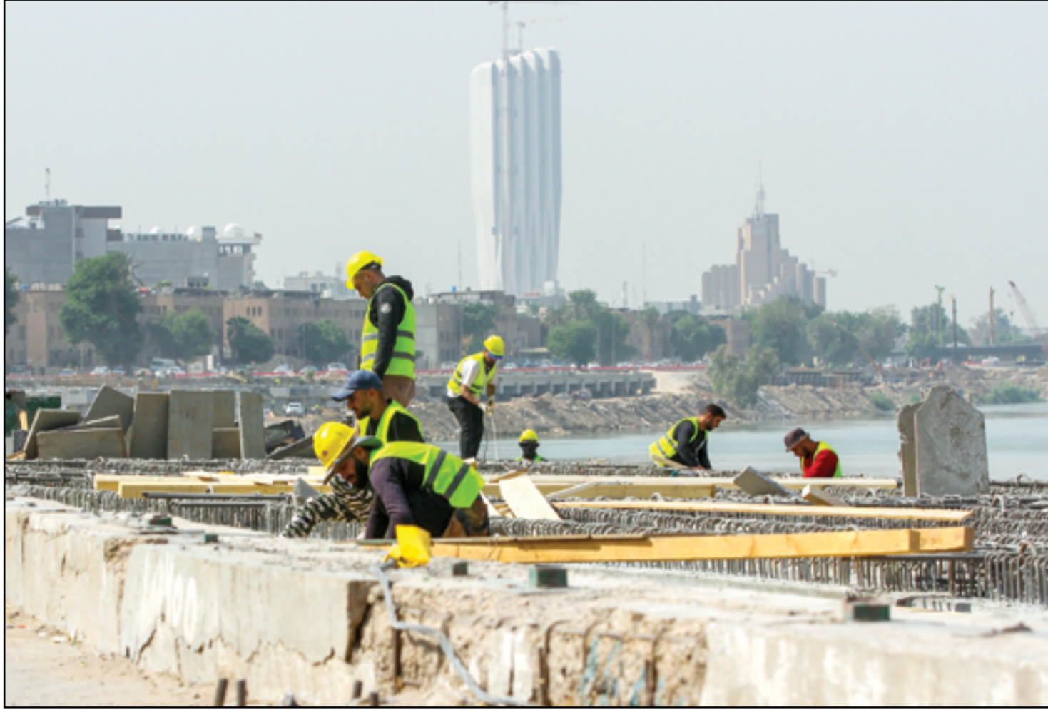
استمرار العمل في مشروع توسعة شارع أبي نواس...

وبالإضافة إلى تلك المشاريع، أشار المتحدث باسم الوزارة، إلى "22 مشروعاً متعلقاً بذاكرة الإعمار الهندسي،