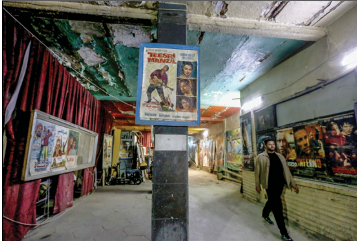
صالات السينما في بغداد تعاني الإهمال..