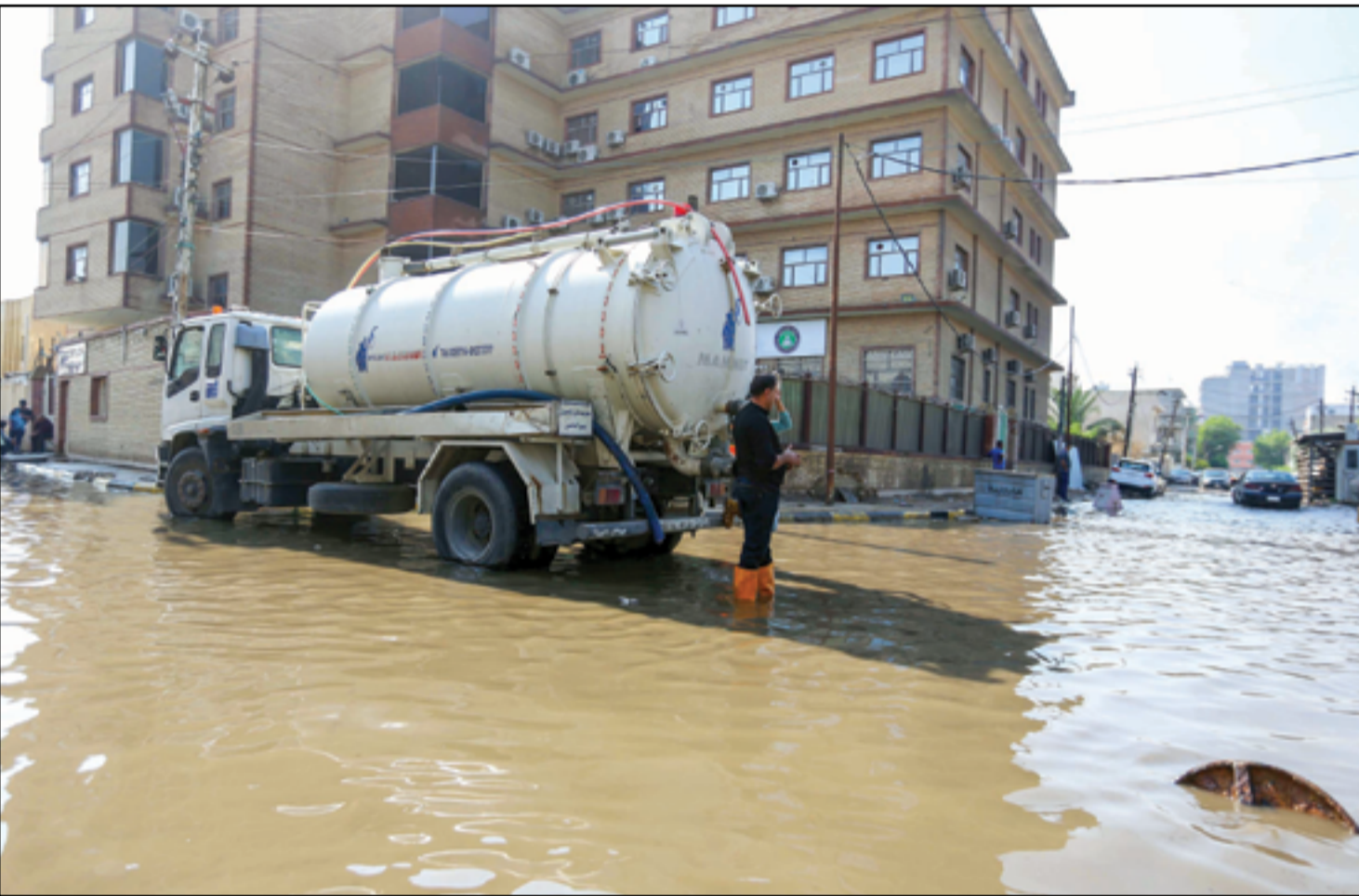
جهود حثيئة من أمانة العاصمة لسحب مياه الأمطار...

■ بغداد / تميم الحسن مرة جديدة، يتصاعد القلق داخل العراق بسبب احتمال استخدام أراضي للرد الإيراني على إسرائيل. وكشفت الدائرة المقربة من محمد السوداني، رئيس الحكومة، عن