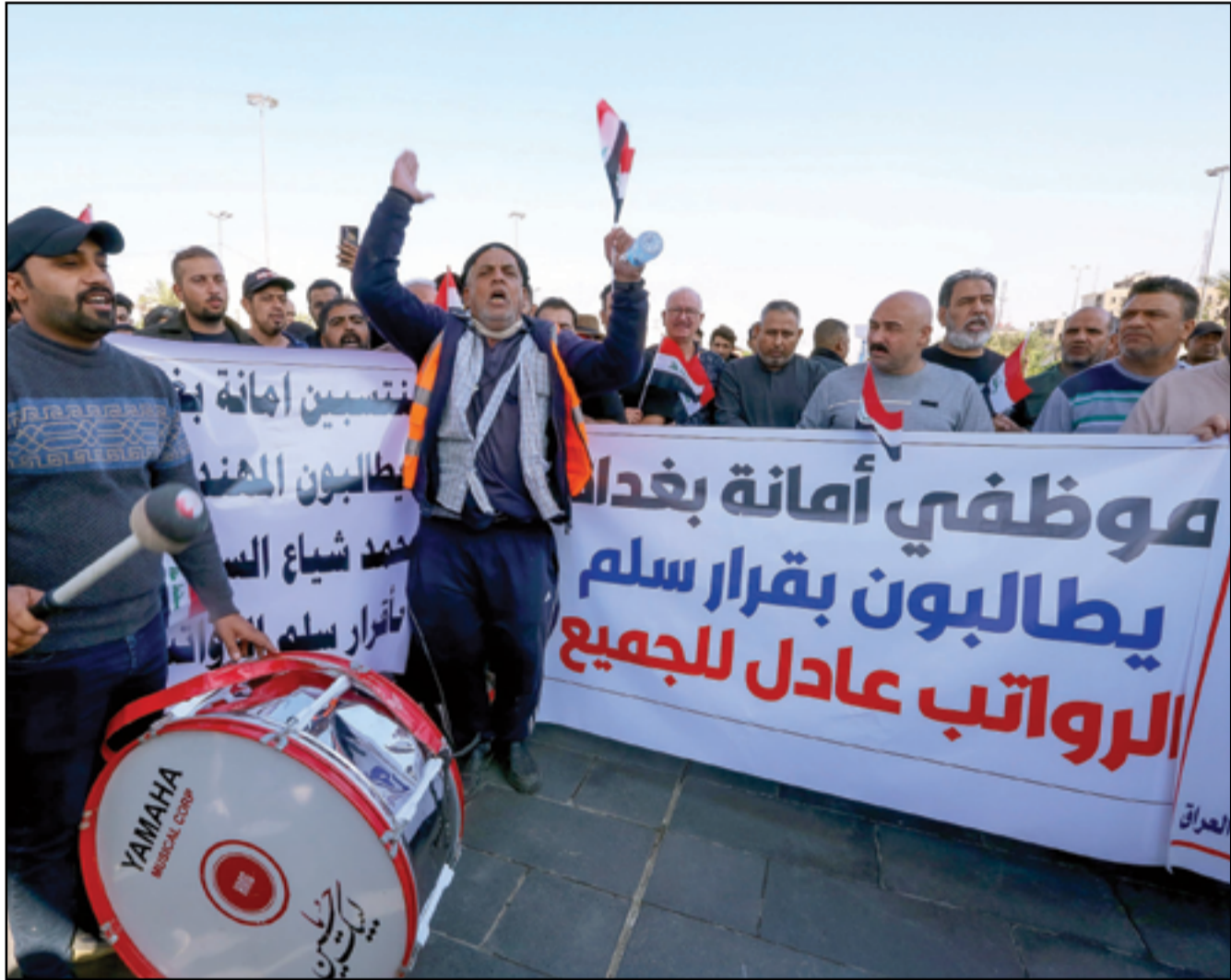
تظاهرات في بغداد لأصحاب العقود...