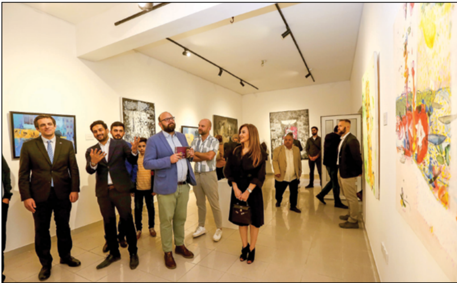
معهد غوته الألماني يدشن مقره الجديد في بغداد بمعرض تشكيلي بعنوان (مئوية رحيل كافكا) بالتعاون مع مؤسسة (المدى). .. عدسة: محمود رؤوف

طالب عبد العزيز يكتب: لماذا لا أطبق سمع راديو عراقي على FM 6