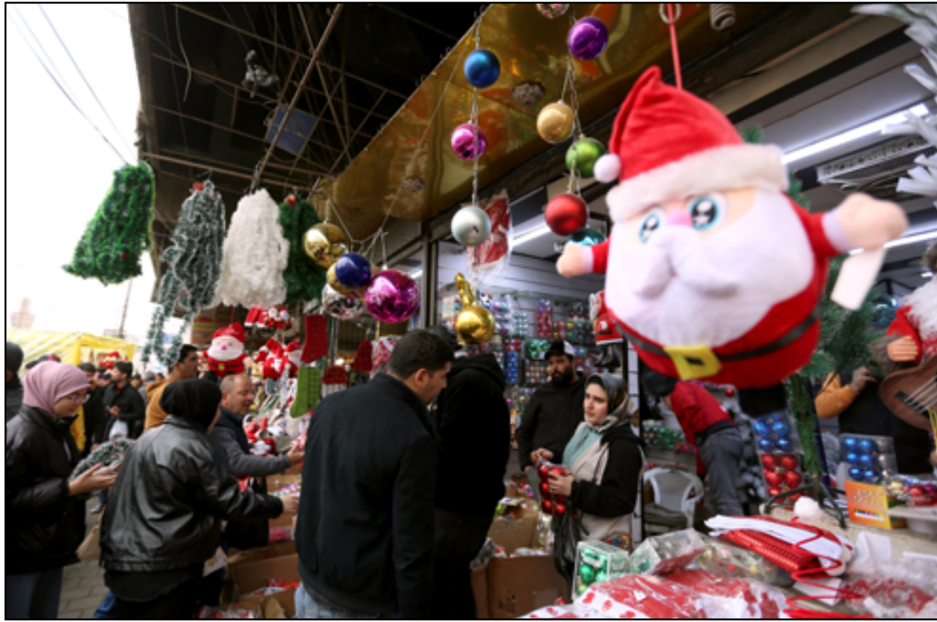
بغداد تستعد لاستقبال اعياد الميلاد...

لا تستبعد قوى في كركوك أن تكون "الخلافات السياسية" وراء نشر "دعوات مضخمة" عن وجود "داعش" في المدينة. المحافظة تعاني منذ أشهر من "شلل سياسي"، فيما تنتظر هذا الأسبوع قرار القضاء بشأن تشكيل الحكومة في كركوك. لكن ذلك لا يخفي تسجيل حوادث أمنية "مريبة" في كركوك نسبت لتنظيم "داعش"، وعودة ظهور الانتحاريين خلال الشهرين الماضيين. الحديث عن المدينة الأكثر جدلاً في العراق يأتي بعد أنباء متضاربة عن تعليق مجهولين "رأية داعش" على مدرسة في كركوك. كذلك، تزامنت هذه الأحداث مع تحذيرات وزير الخارجية فؤاد حسين بشأن إعادة تنظيم "داعش" صفوفه بعد سقوط النظام السوري. وأضاف حسين، خلال اتصال مع وزير بريطاني، أن التنظيم "استولى على كميات من الأسلحة نتيجة انهيار الجيش السوري وتركه مخازن أسلحته، مما أتاح له توسيع سيطرته على مناطق إضافية"، وفق بيان للخارجية. وحذر حسين، بحسب البيان، من خطورة هروب عناصر "داعش" من السجون ومن انفلات الوضع في مخيم الهول، وانعكاس ذلك على الأمن في سوريا والعراق. وتحتضن مدينة الهول، التابعة لمحافظة الحسكة شمالي سوريا، مخيم الهول الذي يعد من أكبر المخيمات، إذ يضم نحو 40 ألف نازح من 42 جنسية مختلفة، بينهم عائلات مسلحة تنظم "داعش" العراقيين والسوريين والأجانب.