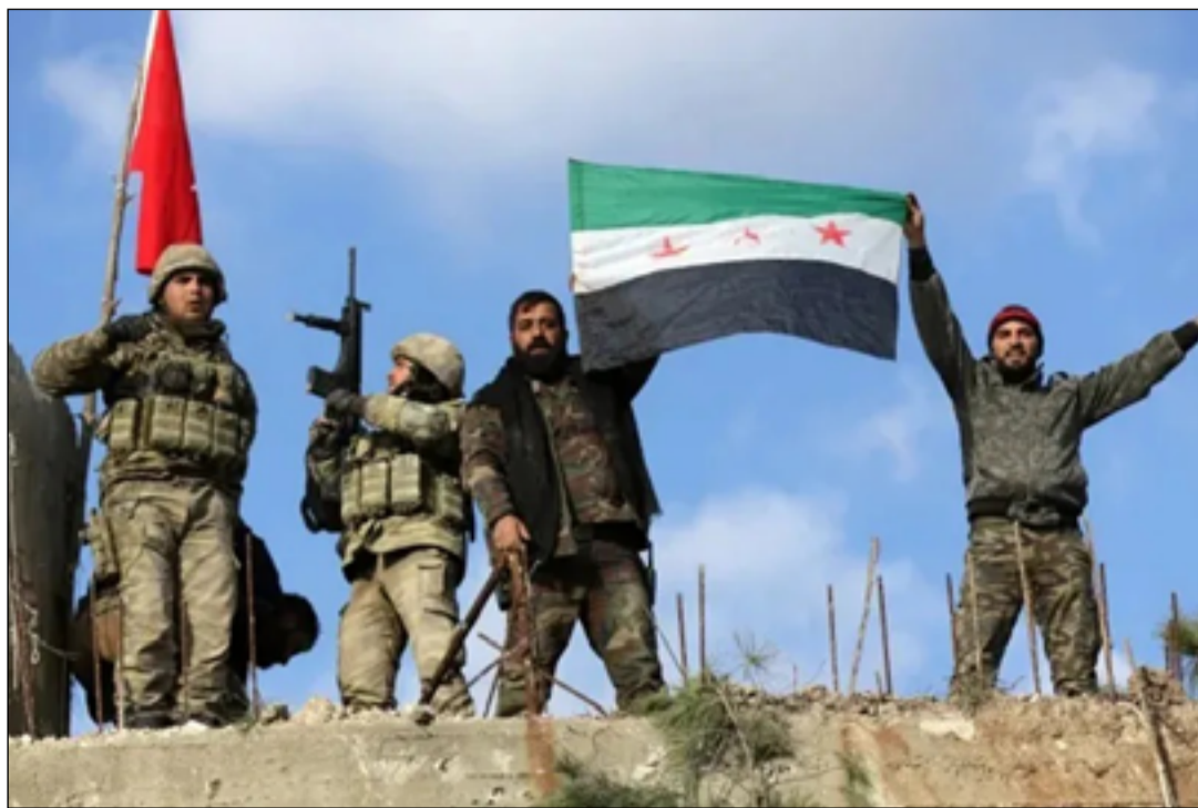
بمحاولة استغلال الفراغ بالسلطة في سوريا، لسحق المناطق التي يسيطر عليها الأكراد في شمالي البلاد. تجري القوى السياسية الكردية في شمال بينها لاحتواء «الخلافات»، وتشكيل وفد شرقي سوريا اتصالات ومشاورات فيما

ويتقدم حالياً «الجيش الوطني» إلى المناطق التي يسيطر عليها الأكراد في شمالي سوريا، وتواجه تركيا اتهامات