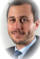
نويس دي ياميلون