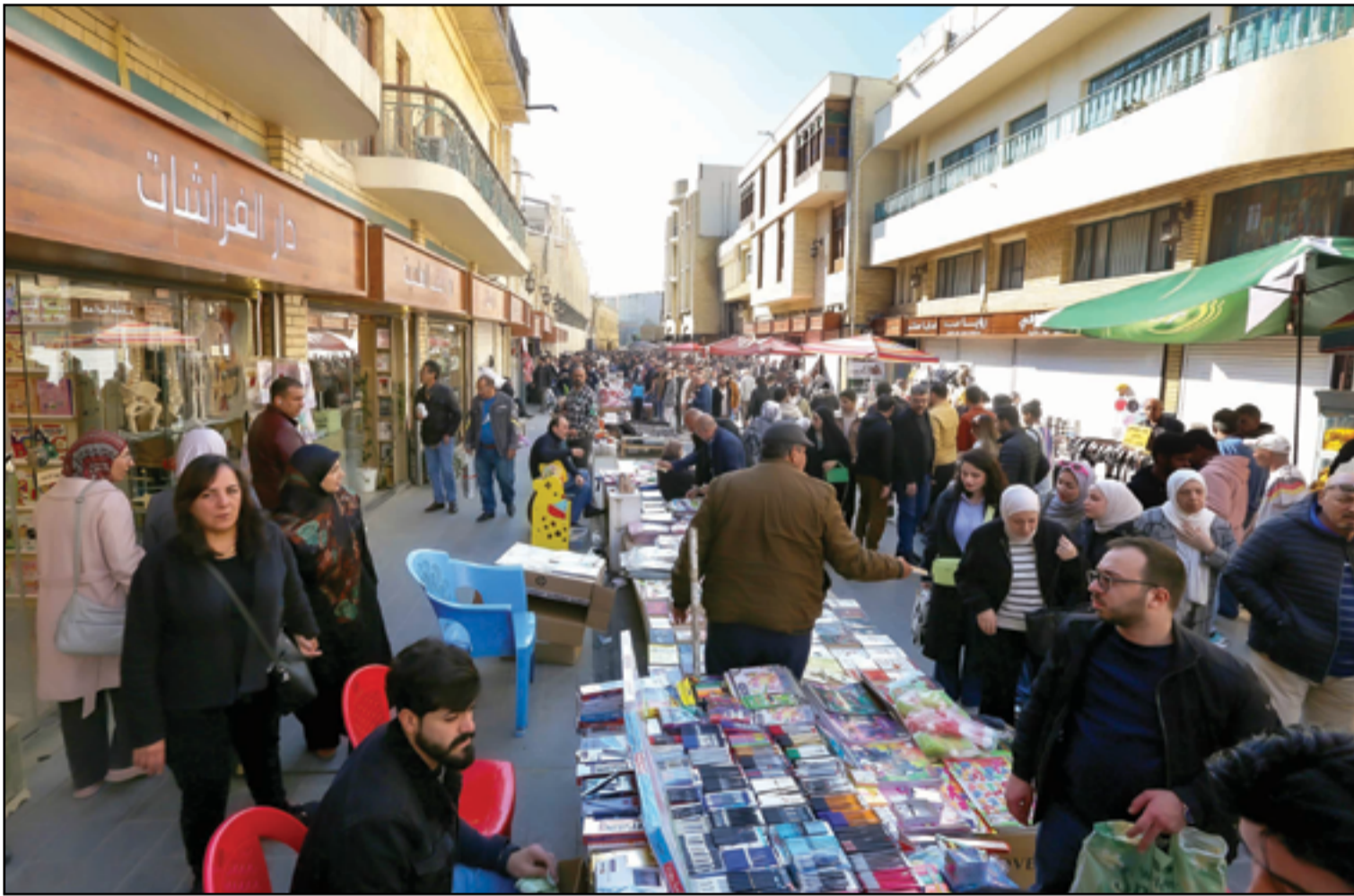
شارع المتنبّي يشهد إقبالاً لمناسبة أعياد العياد...

وخلال لقاء السوداني مع رئيس «تيار الحكمة»، عمار الحكيم، تم تحميل القوى السياسية العراقية مسؤولية الإخفاق في الحفاظ على استقرار العراق، ولأول مرة منذ فترة طويلة، وفي سياق المباحثات التي يجريها السوداني مع الزعامات السياسية، اتفق الطرفان وفقاً للبيان الصادر عن اللقاء على تحميل القوى السياسية المسؤولية، في وقت لا تزال الخلافات مستمرة بين مختلف القوى السياسية، بما في ذلك «قوى الإطار التنسيقي».