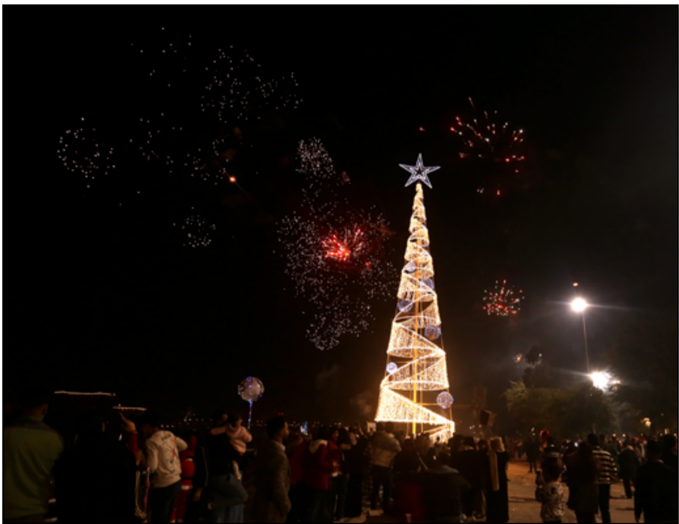
بغداد تحتفل بقدوم عام جديد..

أكد رئيس مجلس الوزراء محمد شياع السوداني، أمس الأربعاء أن عام 2025 سيكون عام استمرار الإنجازات، مشيراً إلى أن الحكومة ماضية ببناء الدولة ومحاربة الفساد وتحقيق الإصلاح. وقال السوداني في بيان بمناسبة حلول العام الجديد، عام جديد مليء بالأمل