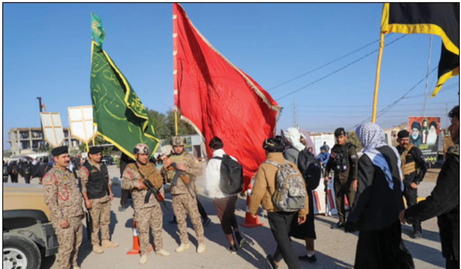
زوار الإمام الكاظم يتوافدون إلى مدينة الكاظمية

دعا رئيس تحالف العزم، مثنى السامرائي، رؤساء التحالفات أعضاء تحالف إدارة الدولة وأعضاء مجلس النواب "المضي في تشريع تعديل قانون الموازنة"، مؤكداً أن الموازنة العامة شهدت "خسارة مبالغ كبيرة" تجاوزت "18 مليار دولار" نتيجة توقف تصدير النفط المنتج في إقليم كردستان. السامرائي أعرب في بيان أمس الاثنين، عن استغرابه من "التصريحات المضللة والتصرفات غير المسؤولة التي تسعى إلى عرقلة الإجراءات الفنية والحلول العملية لمعالجة الملفات الاقتصادية العالقة". يأتي ذلك، بينما نشرت الدائرة الإعلامية لمجلس النواب جدول أعمال جديد لجلسة اليوم الثلاثاء يتضمن التصويت على مشروع التعديل الأول لقانون الموازنة العامة. وخرج برلمانيون من الجلسة يوم أمس الأول مخلصين بالنصاب بعد إدراج التصويت على التعديل على جدول أعمالها عقب التصويت عليه في اللجنة المالية النيابية. وبين في هذا السياق أن الموازنة العامة شهدت "خسارة مبالغ كبيرة نتيجة توقف تصدير النفط المنتج في إقليم كردستان لأسباب تتعلق بتحديد كلف الإنتاج والنقل ومستحقات الشركات النفطية الدولية العاملة في إقليم كردستان". إن هذا التوقف نجم عن "تقديرات سريعة دقيقة أو غير دقيقة لكل النقط المستخرج من حقول إقليم كردستان، وفق السامرائي، الذي أشار إلى أن كلف