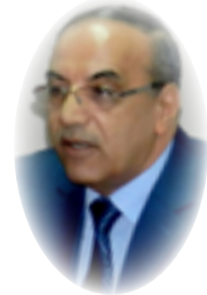
هادي عزيز علي

حراك غير مسبوق للشعب المغربي المنابر من اجل تحديث مدونته الاسرية، رؤى وافكار وطروحات وسجلات افضت الى مقترحات عدة دخل منها قائمة التوصيات المطلوبة للتعديل. العاهل المغربي حاضرا ومتماهيا ومستجيبا ومبارا في رسالته المضمنة توجيهاته الى رئيس الوزراء ودعوته لتعديل المدونة خلال مدة زمنية محددة ووجيزة. التوجيهات الملكية حملت طابعا تنويريا تلمز باستخدام الاجتهاد البناء لضمان التوافق بين المرجعية الاسلامية والمستجدات الحقوقية العالمية والمحافظة على المبادئ الاساسية مثل العدل والمساواة والتضامن والانسجام المستمدة من الاسلام والاتفاقات الدولية. التوعية هذه نادرا وجودها لدى زعيم عربي معاصر. وعلى هذا فان التوجيهات جاءت الافكار والرؤى تترى منها: