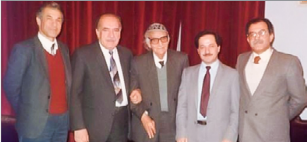
الجواهري في الوسط والى يساره مسعود بارزاني وفخري كريم، والى يساره خالد بكداش وعبد الرزاق الصافي - دمشق 1989

وصلني منك قبل فترة كتيب مهم جدا، بعنوان (شخصيات وأسماء وشؤون ثقافية والاعلام، "لجوء" انسب، نسبيا