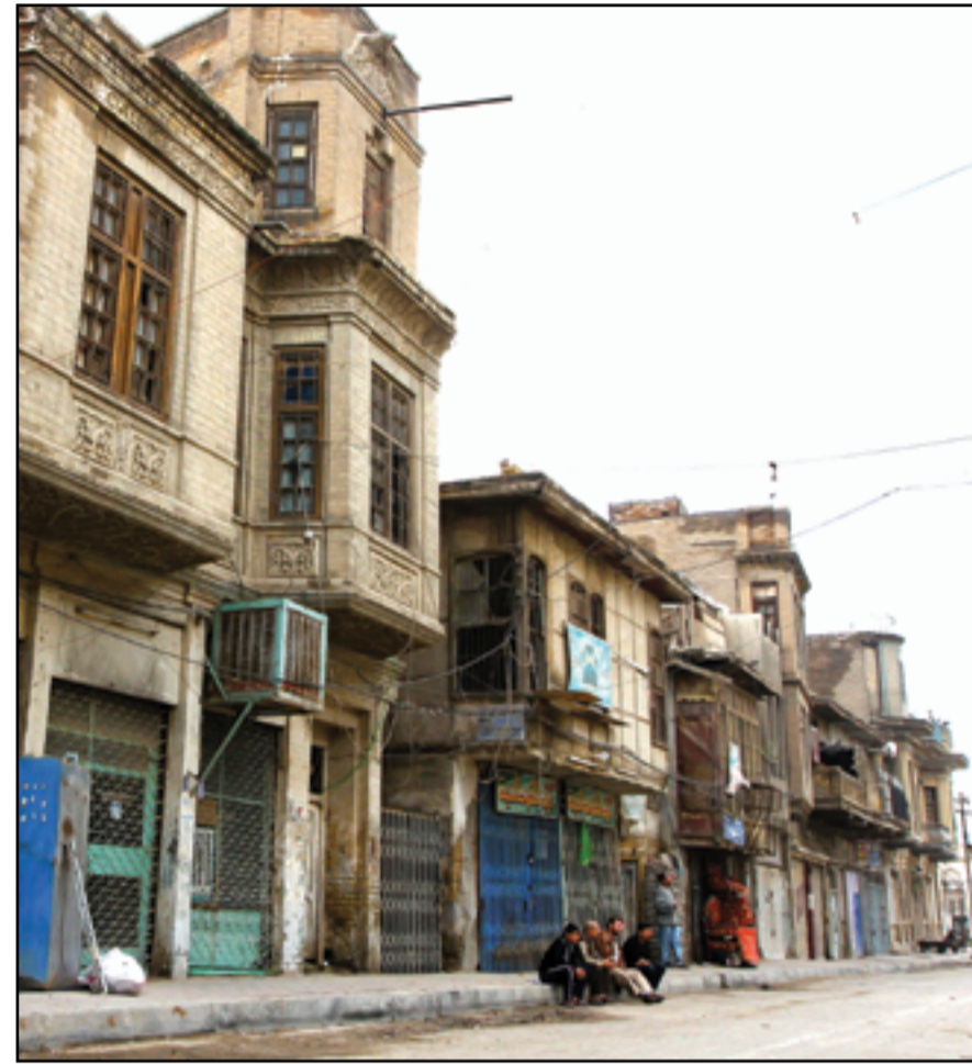
بيوت بغداد التراثية تعاني من الإهمال...

بغداد / المدى صوت مجلس النواب، على مشاريع قوانين تعديل الأحوال الشخصية والعفو العام وإعادة العقارات إلى أصحابها. وافتتح جلسة البرلمان، أمس الثلاثاء رئيس المجلس محمود المشهداني. وجرى خلال الجلسة، التصويت على "مقترح قانون الأحوال الشخصية رقم (188) لسنة 1959"، وكذلك على "مشروع قانون إعادة العقارات إلى أصحابها المشمولة ببعض قرارات مجلس قيادة الثورة (المختل)، إضافة إلى "مشروع قانون التعديل الثاني لقانون العفو العام رقم (27) لسنة 2016"، وفقاً للدائرة الإعلامية. وكان البرلمان العراقي فشل في أكثر من جلسة بتعمير مشاريع القوانين الثلاثة، لكن جرت القراءتان الأولى والثانية لمشروع قانون إعادة الدور والأراضي التي صودرت بموجب قرارات مجلس قيادة الثورة المنحل إلى مالكيها الأصليين، ولم يبق غير التصويت عليه. وأشارت هذه القوانين الكثير من الجدل، بين مؤيد ومعارض لها، من قبل الكتل السياسية، كما واجهت هذه القوانين اعتراضات من قبل المتخصصين والمنظمات المدنية.