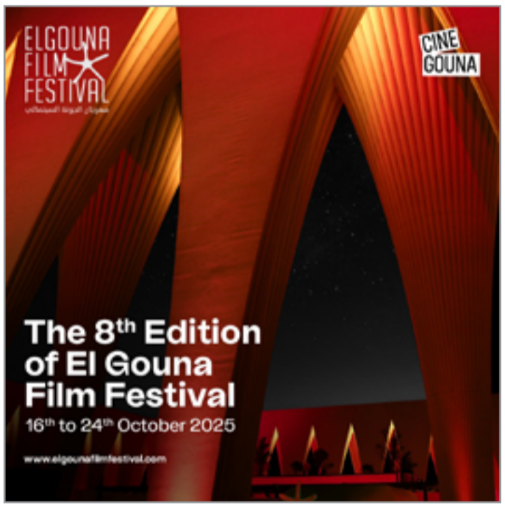
المزيد من التحديتات حول الدورة الثامنة لمهرجان الجونة السينمائي، يرجى زيارة الموقع www.elgounafilmfestival.com.

مزيد من التحديتات حول الدورة الثامنة لمهرجان الجونة السينمائي، يرجى زيارة الموقع www.elgounafilmfestival.com. ومهرجان الجونة السينمائي أحد المهرجانات الأربعة في منطقة الشرق الأوسط وشمال إفريقيا، ويعرض سنوياً مجموعة واسعة من الأفلام من جميع أنحاء العالم، مع التركيز على السينما العربية، لجمهور متحمس ومطلع. يعزز المهرجان التواصل بين الثقافات من خلال فنون السينما، ويهدف إلى ربط صانعي الأفلام من المنطقة بنظر أنهم الدوليين، وتشجيع التعاون والتبادل الثقافي. علاوة على ذلك، فهو يعزز ويدعم نمو الصناعة في المنطقة ويوفر منصة لصانعي الأفلام لدعم وعرض أعمالهم مع اكتشاف أصوات ومواهب جديدة.