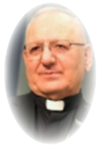
الكاردينال لوييس روهانيل ساكو

الدولة المدنية هي الخيار الأفضل، الدولة المدنية ليست ضد القيم الدينية، ولا تأخذ مكان رجال الدين، الدستور المدني يساوي بين كل المواطنين على اختلاف أديانهم وطوائفهم. كذلك المرجعيات الدينية أياً كانت لا ينبغي أن تفرض تشريعاتها على المجتمع. الدين يعرض ولا يفرض. والدين في خدمة الناس؛ ومن ثم، ينبغي على الدولة أن تتبنى قانون الأحوال الشخصية المدني المعمول به في معظم دول العالم ومنها العربية، وتترك الممارسة الدينية للأفراد بحسب إيمانهم الديني أو المذهبي. الدين للأفراد وليس للدولة!