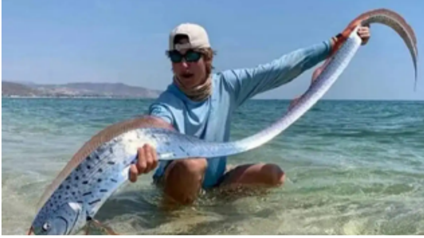
متابعة / المدى

تسونامي. وتثير هذه الأسماك عادة الأسطورة اليابانية التي تعتبرها نذيراً للزلازل والكوارث الطبيعية. ورغم عدم وجود دليل علمي على صحة هذه العلاقة، فإن البحر قد جرف عشرين سمكة مجدفية إلى الشاطئ قبل أشهر من وقوع تسونامي اليابان المدمر في مارس 2011، والذي أسفر عن مقتل أكثر من 15 ألف شخص وزلازل بقوة 9.0 درجات. وتعتبر سمكة المجداف في الأساطير اليابانية الرسول من قصر إله تينين البحر ونشاهد كعلامة تحذير من الزلازل. ووفقاً للأسطورة، تعيش هذه الأسماك تحت جزر اليابان وتظهر على السطح لتحذير السكان من زلازل وشيك. وعلى الرغم من وجود هذه المخلوقات في جميع أنحاء العالم، فإنها تعيش على أعماق تتراوح بين 56 و 3780 قدماً (حوالي 200 إلى 1000 متر) تحت سطح البحر.