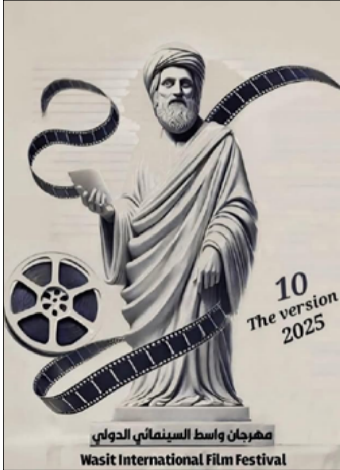
10 The version 2025 مهرجان واسط السينمائي الدولي Wasit International Film Festival

صدرت عن دار المدى الترجمة العربية لرواية "المرأة المسكونة" للكاتبة جيوكندا بيلي، ترجمة روعة حقي. وتدور أحداث الرواية في نيكاراغوا وسط جنوبي أمريكا اللاتينية وقت الغزو الأسباني عليها، فوجد شخصية "أيتسا" التي تنتمي لما بعد انتهاء الغزو وعصر الاكتشاف. بدأت جيوكندا بيلي حياتها كشاعرة حيث صدر لها العديد من الدواوين الشعرية منها "على العشب"، "خط النار"، "حب منمرد"، "من ضلع حواء"، "عين المرأة"، ثم تحولت لكتابة الرواية منذ الثمانينيات واستلهمتها بهذه الرواية، التي حصلت بها على جائزة "كاسا دي لاس اميركاس" أو ما يعرف بـ "بيت الأمريكيتين" التي تمنح لكتاب أمريكا اللاتينية.