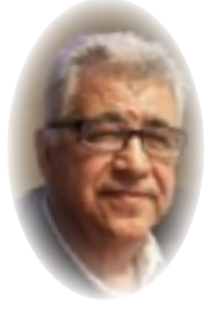
د. فالح الجمراي

وقع الرئيسان فلاديمير بوتين ومسعود بيزشكيان اتفاقية الشراكة الاستراتيجية الشاملة بين روسيا وإيران في 17 كانون الثاني في الكرملين. وجاء توقيع الاتفاقية نتيجة الزيارة الرسمية التي قام بها الرئيس الإيراني إلى موسكو. وأجرى محادثات مع رئيس الوزراء ميخائيل ميشوستين. ووفقاً للرئيس الروسي فلاديمير بوتين "إن الاتفاقية التي وقعناها تخلق أساساً إضافياً مهماً وجدياً لبناء علاقات ذات طبيعة ثقة وعلى أساس المبادئ التي ذكرتها للتو. هذا اتفاق على أولوياتنا، وعلى الالتزام بهذه الأولويات. هذا الاتفاق يسمح لنا بتعزيز علاقاتنا الثنائية لصالح الشعب الإيراني وشعبي الاتحاد الروس".