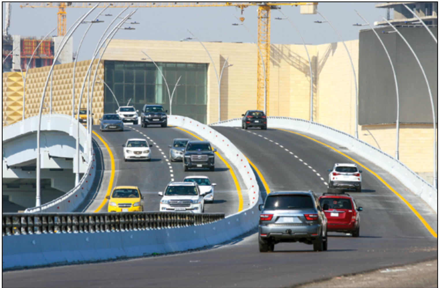
افتتاح مجسر تقاطع المصافي في منطقة الدورة..

الوطنية ويعزز من التدخلات الأجنبية في الشأن الداخلي. وتتصاعد المؤشرات في العراق على بقاء قوات التحالف الدولي لفترة أطول، في ظل التطورات السياسية والأمنية التي تشهدها المنطقة، ويأتي هذا بعد تصريحات وزير الخارجية فؤاد حسين خلال مشاركته في جلسة ضمن المنتدى الاقتصادي العالمي الذي انعقد في دافوس بسويسرا. وأشار حسين إلى أن القوات الأمريكية من المتوقع أن تستمر بالبقاء في العراق، معتبراً أن ذلك يأتي في إطار السياسات الجديدة التي قد تتبناها إدارة الرئيس الأمريكي الجديد. وقال حسين: "أعتقد أنهم سيقفون هناك (في العراق)". وتوصلت بغداد وواشنطن في يوليو/تموز الماضي إلى اتفاق يهدف إلى تحقيق انسحاب تدريجي لقوات التحالف الدولي من الأراضي العراقية، ويتضمن الاتفاق جدولاً زمنياً يمتد لعامين، يبدأ بتقليص عدد الجنود بمئات العناصر بحلول سبتمبر/أيلول 2025، على أن يكتمل الانسحاب بشكل شامل بحلول نهاية عام 2026. وأبدت جهات سياسية عراقية رفضها لبقاء قوات التحالف الدولي على الأراضي العراقية، معتبرة أن وجود هذه القوات يمثل انتهاكاً للسيادة