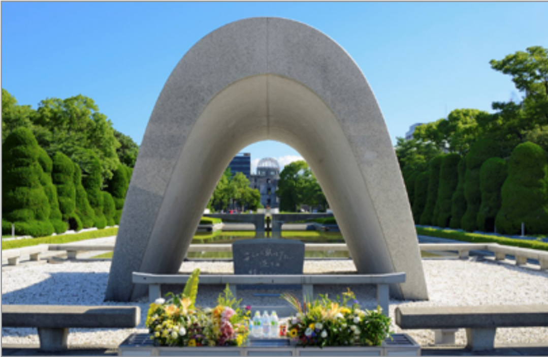
مشروع "متحف هيروشيما التذكري للسلام" (1952 – 1955). هيروشيما/اليابان، المعمار: "كينزو تانغا"، تفصيل عند القوس.

من هنا يسعى هذا الكتاب عبر مساهمات متنوعة للمشاركين فيه إلى اقتناص فرصة تأمل العلاقة بين الأدب والسينما مرة أخرى ويؤايلنا نظر مختلفة، سواء بقراءة وتحليل الأعمال السينمائية اقتبسة عن أعمال أدبية أو مسرحية، والتعبير عن رأينا بشأنها، فإلى