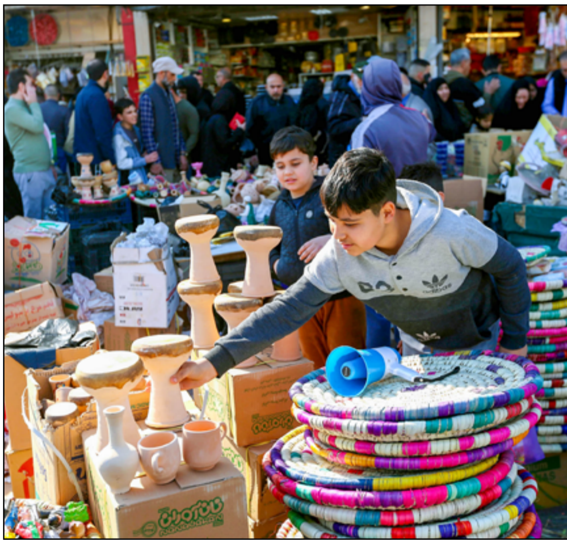
العراقيون يحتفلون بعيد زكريا... علسة: محمود رؤوف

مرة أخرى، عاد الإطار التنسيقي الشيعي إلى سياسة "التخويف"، كما يصفه محللون، من وجود مؤامرة قد يكون وراءها حزب البعث المحظور. إطلاق التحذيرات من "فتنة"، حسبما يقول نوري المالكي، رئيس الوزراء الأسبق، يتصاعد دائماً