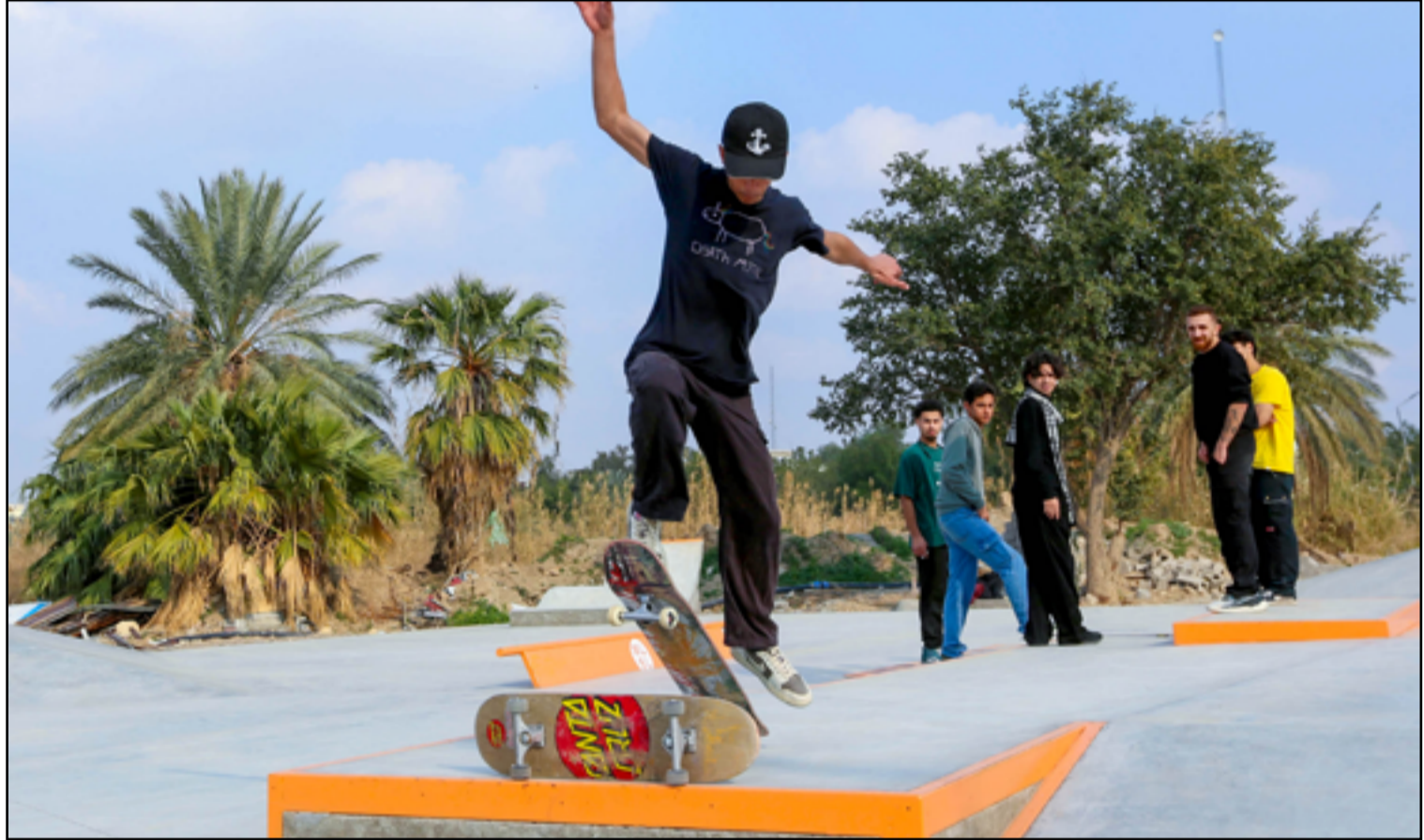
شباب بغداد يجردون متنفساً جديداً في أول ملعب تزلج تفتتحه وزارة الشباب والرياضة بالعاصمة.. عديسة: محمود رؤوف

بغداد / المدى كشفت وزارة العدل عن وجود 65 ألف سجين في سجونها، من ضمنهم 85 طفلاً يعيشون مع أمهاتهم في السجون. وقال أحمد لعبيبي، المتحدث باسم وزارة العدل العراقية، في تصريح صحفي إن "هناك 65 ألف سجين موزعين على 30 سجناً في العراق". فيما يتعلق بالسجناء الأجانب، قال المتحدث باسم وزارة العدل العراقية إن "هناك 1600 سجين أجنبي". وتحدث لعبيبي عن تنفيذ قانون العفو العام، مشيراً إلى أنه سيبدأ حيز التنفيذ فور المصادقة عليه بشكل كامل ونشره في الجريدة الرسمية العراقية. وفي 4 شباط الجاري، أصدرت المحكمة الاتحادية العليا، أعلى سلطة قضائية في العراق، أمراً بإيقاف تنفيذ ثلاثة قوانين هي: قانون الأحوال الشخصية، وقانون العفو العام، وقانون إعادة الأراضي إلى أصحابها الأصليين، وذلك بناءً على خمس شكاوى، حتى يتم البت في الشكاوى المسجلة. وفي اليوم التالي، اجتمع مجلس القضاء الأعلى العراقي وعارض قرار المحكمة الاتحادية العليا، واصفاً إياه بـ "غير القانوني". وقد تمت الموافقة على القوانين الثلاثة كحزمة واحدة في جلسة البرلمان العراقي يوم 21 كانون الثاني 2025. وكانت منظمة "هيومن رايتس ووتش" قد انتقدت في تقارير لها أوضاع السجون في العراق، وأن "غالبية السجون تعاني اكتظاظاً بأعداد السجناء، وإهمالاً، وانعدام الخدمات، وتردي الأوضاع المعيشية والصحية التي ساهمت في انتشار الكثير من الأمراض الجلدية والمعدية بينهم".