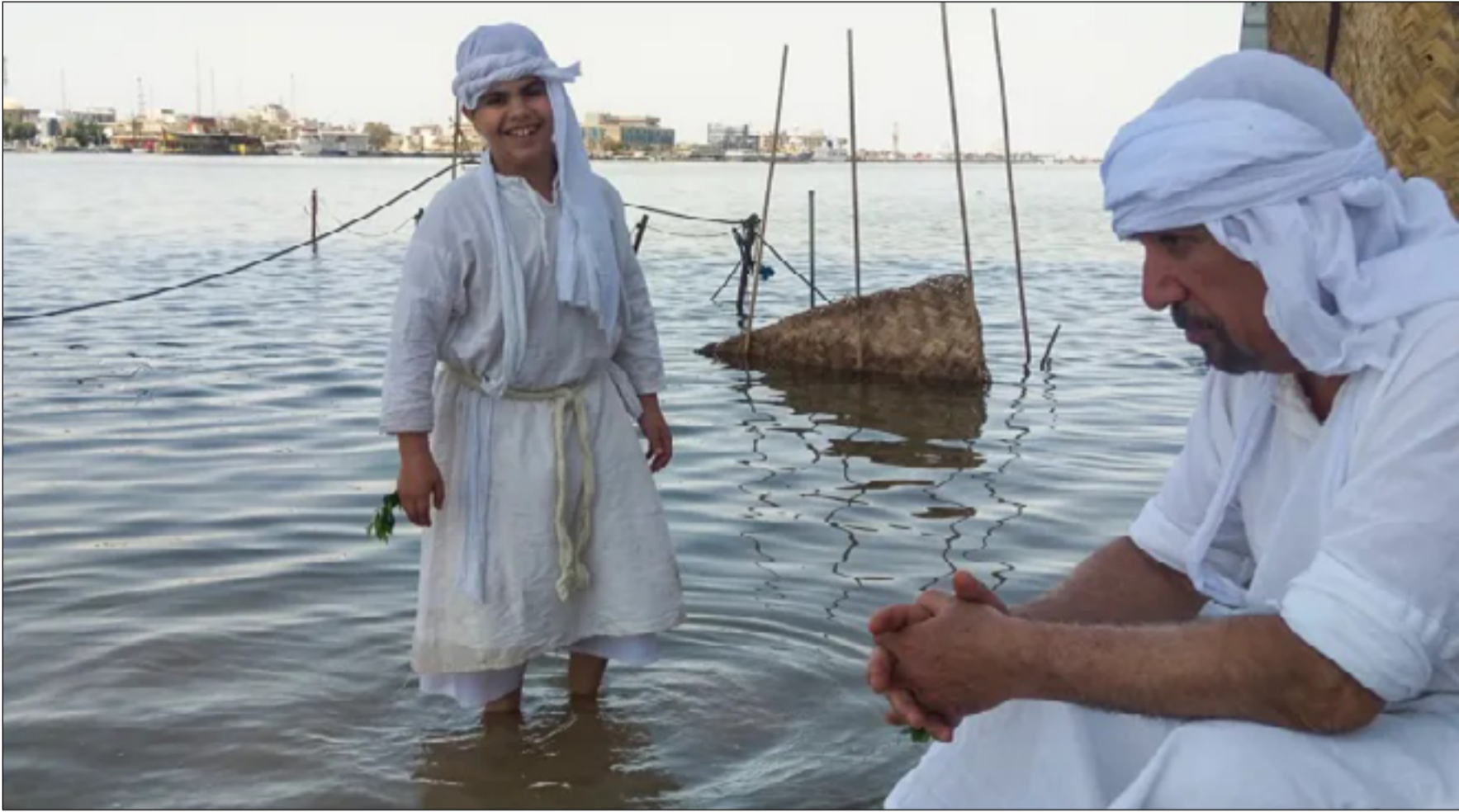
ذي قار / حسين العامل

بعد ان كان عدد من يجيدون اللغة المندائية في ذي قار خمسة اشخاص قبل ١٥ عاما تراجع الي ثلاثة فقط، مما يثير المخاوف من انقراض اللغة التي تعد مهد الديانة التوحيدية للصابئة وغيرهم من الديانات، حيث لازال بيت أب الأنبياء النبي إبراهيم الخليل(ع) شاخصا في مدينة اور السومرية ويحظى باهتمام كبار رجال الدين في العالم.