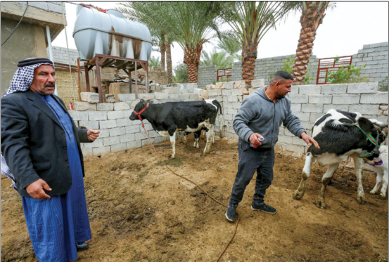
حملة بيطرية للحد من انتشار الحمى القلاعية.. عسة: محمود رؤوف