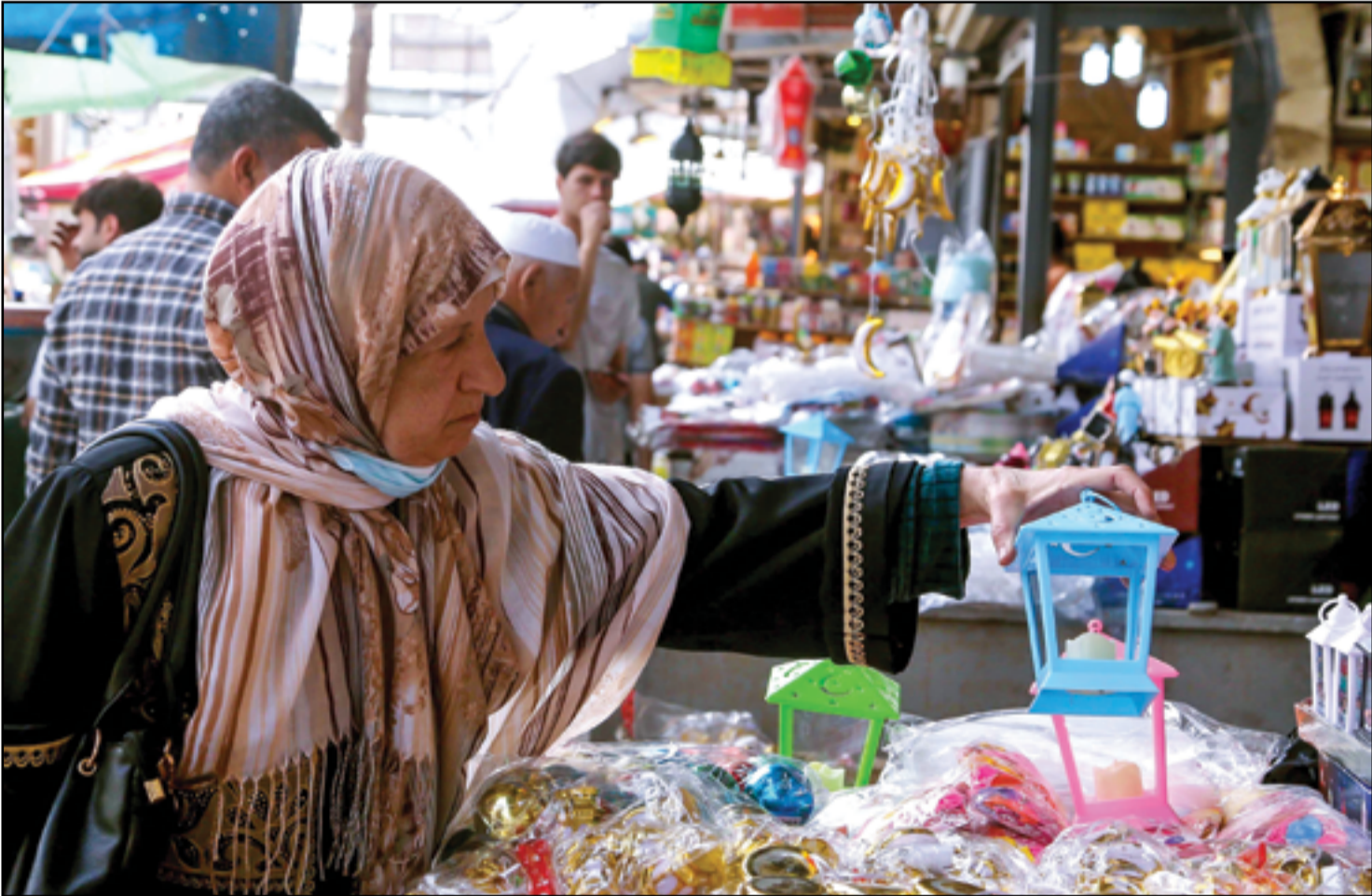
عراقيون يستعدون لشهر رمضان..

وكان فريق من المجلس الدنماركي للاجئين DRIC والوكالة السويسرية للتنمية والتعاون