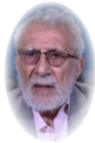
غالب حسن الشابندر

تحتل القضية الاخلاقية مكانة قصوى في اهتمامات السيد حسين إسماعيل الصدر، فالرجل لا يكاد يترك قضية في مسائل الاجتاع والحقوق والواجبات والمواطنة حتى نجد للاخلاق مساحة كبيرة في طرحه أو طروحاته وأفكاره وفلسفته، ولا زال اذكر في إحدى لقاءاته به حفظه الله وانا اتحدث معه عن مشكلة العقل في الفكر الفلسفي ونيتي أن اكتب في ذلك -صدر لي ثلاث أجزاء عن هذه الموضوعة الخطيرة - حتى سابقتي بالكلام شبه معترض، وكان فحوى اعراضه الأدبي من أن المسألة الشائكة اليوم في الاجتماع الانساني هي: (الأخلاق)، والسيد ابو علي عندما ينظرق إلى الاخلاق ليس من منطلق عرفي أو تقليدي بل من منطلق عقلي، من جهة أن الاخلاق احدى اهم مساحات التفكير الفلسفي امس واليوم وربما غدا.