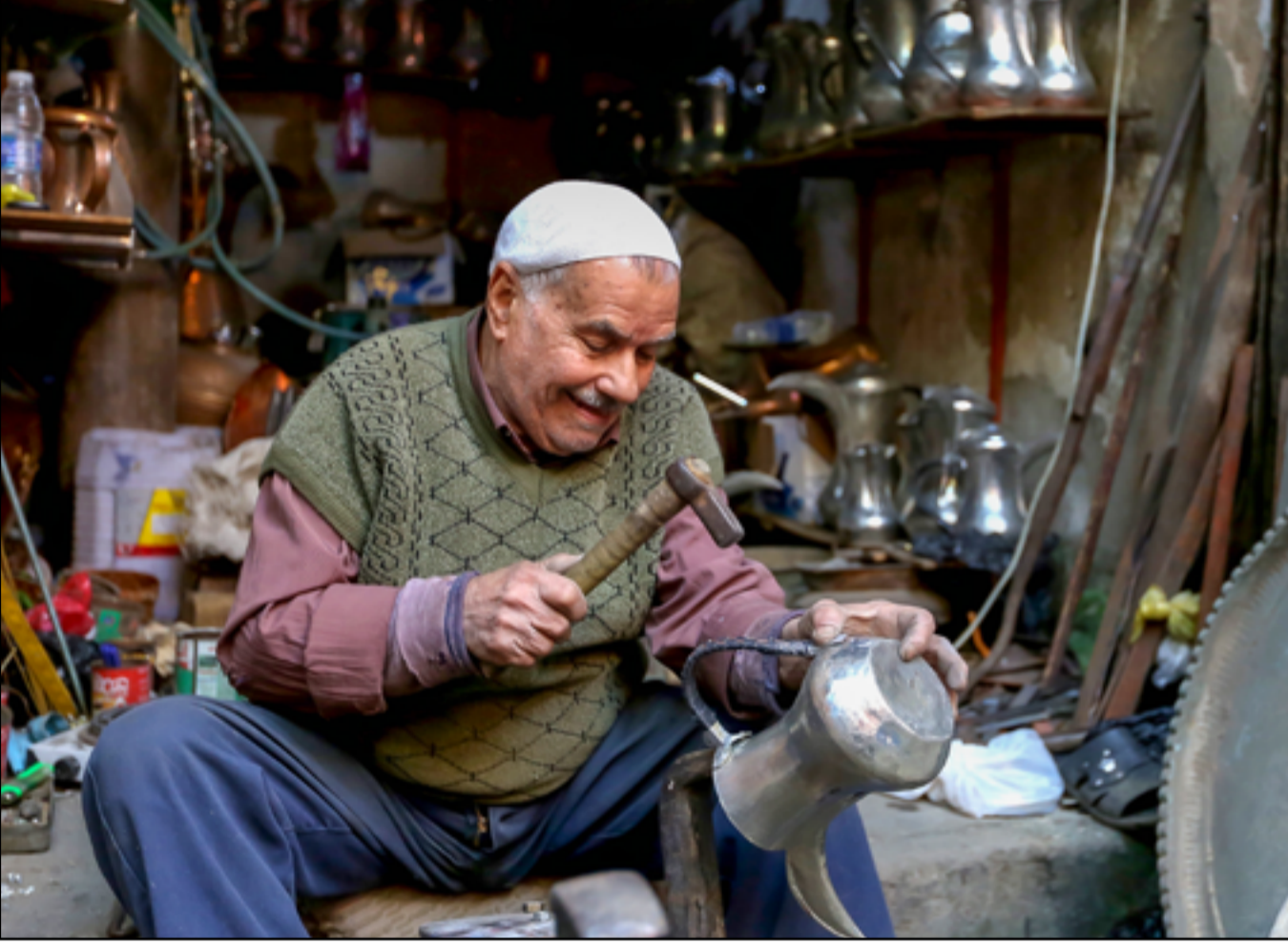
ورشة لصناعة دلال القهوة العربية.. عذسة: محمود رؤوف