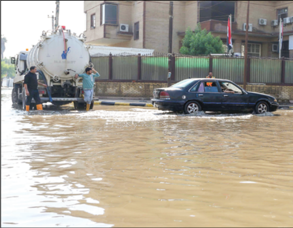
أمطار نهاية الشتاء تغرق بغداد...