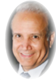
عبد الرحمن الراشد