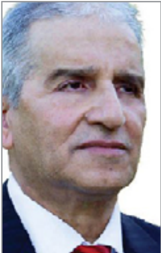
أديب كمال الدين

تعرض المتقفون العراقيون على مدى الخمسين عاماً المنصرمة للنفي والتهميم القسري، بسبب القسوة والقمع الذي مارسه الأنظمة التي حكمت العراق منذ 1958 وحتى الآن، لكنهم استمروا بإبداعاتهم التي توزعت بين الشعر، والسرادية، والأدب، والتشكيل، والموسيقى.. والتي تضحوت بعبير المنفى. فكانت نتاجاتهم تشير على الدوام لهذا النفي، وأماكنه، فهل وجدوا في غربتهم الحقيقية فضاءهم الإبداعي ومستقرهم، وهل أضاف المنفى شيئاً لإبداعهم، وهل أسهم ذلك في تطوير تجربتهم الأدبية والفنية.. وبما علاقة مكان المنفى بذلك.