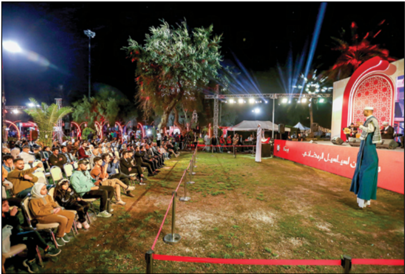
المهرجان الرمضاني الذي أقامته أسبائيل على حدائق أبي نواس.. عدسة: محمود رؤوف

بعودة نشاط الفصائل الموالية لإيران". وفي غضون الأسبوع الأخير، أعلنت ثلاثة تشكيلات مسلحة، من بينها واحد يحمل اسم "استشهادي"، عن خطابات تصعيدية تهدد بضرب المصالح الأمريكية في العراق. هذا التهديد دفع رئيس الحكومة، محمد شياع السوداني، إلى طمأنة واشنطن خلال اتصال جرى مع وزير الدفاع الأمريكي، الأحد الماضي. وقالت تقارير غربية إن وزير الدفاع الأمريكي،