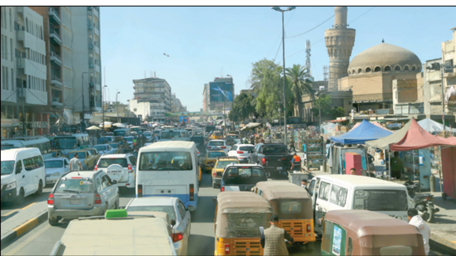
الأزدحامات تشل شوارع بغداد...