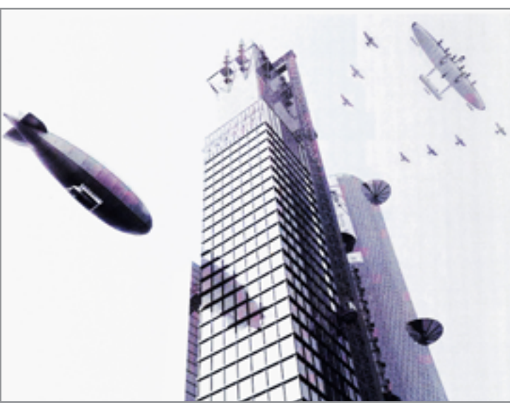
مشروع وزارة الصناعات الثقيلة، موسكو، الساحة الحمراء (1934)، المعمار: إيفان ليُونيدُوف، منظور، تفصيل.

الاحداث لتكشف عن ماضي العائلة المخيا، وتطرَح تساؤلات حول إمكانية كسر القيود المفروضة من "البند الأبوي" الذي يربط أفراد العائلة. يتيمّن خميري بأسلوب سردي مبتكر، حيث يستخدم تقنيات متعددة مثل تعدد الأصوات، والتلاعب بالزمن، واللغة الرمزية. تسهم هذه الأساليب في خلق تجربة قراءة غنية ومعقدة، تعكس التوترات الداخلية والخارجية التي يواجهها الأفراد في مجتمع متعدد الثقافات. حصلت الرواية على جائزة "ميديسيس للرواية الأجنبية" لعام 2021، مما يعكس تقدير النقاد و الجمهور لأدب خميري الفريد.