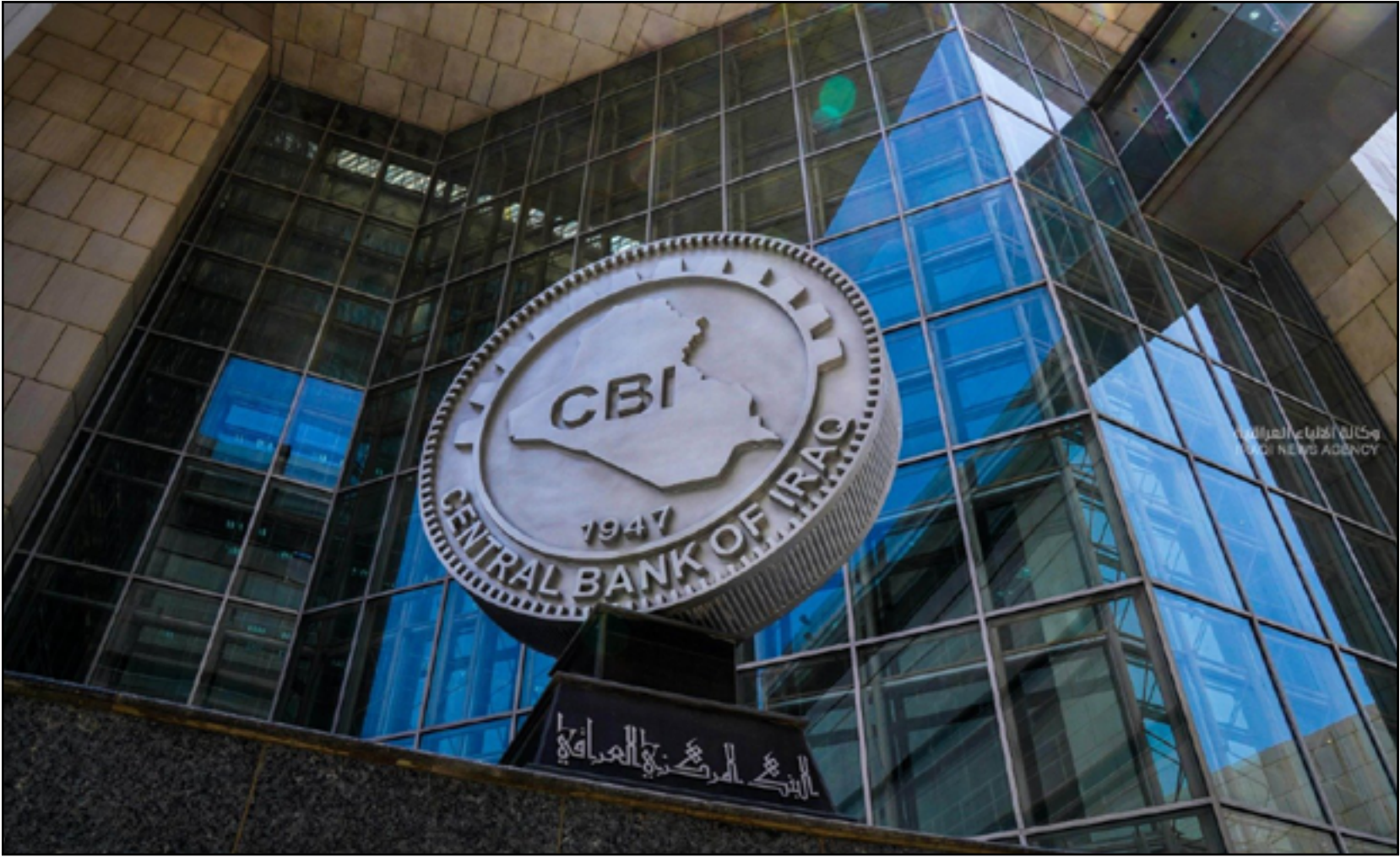
بنك العراق المركزي