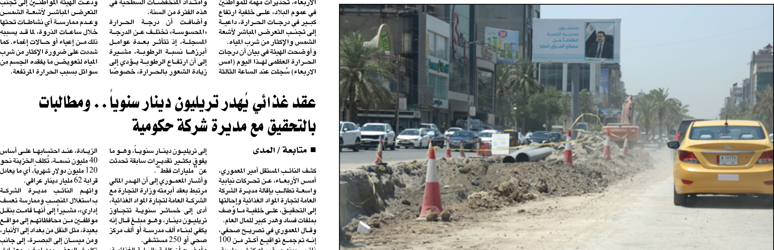
أمانة بغداد تواصل حملة أعمار العاصمة..