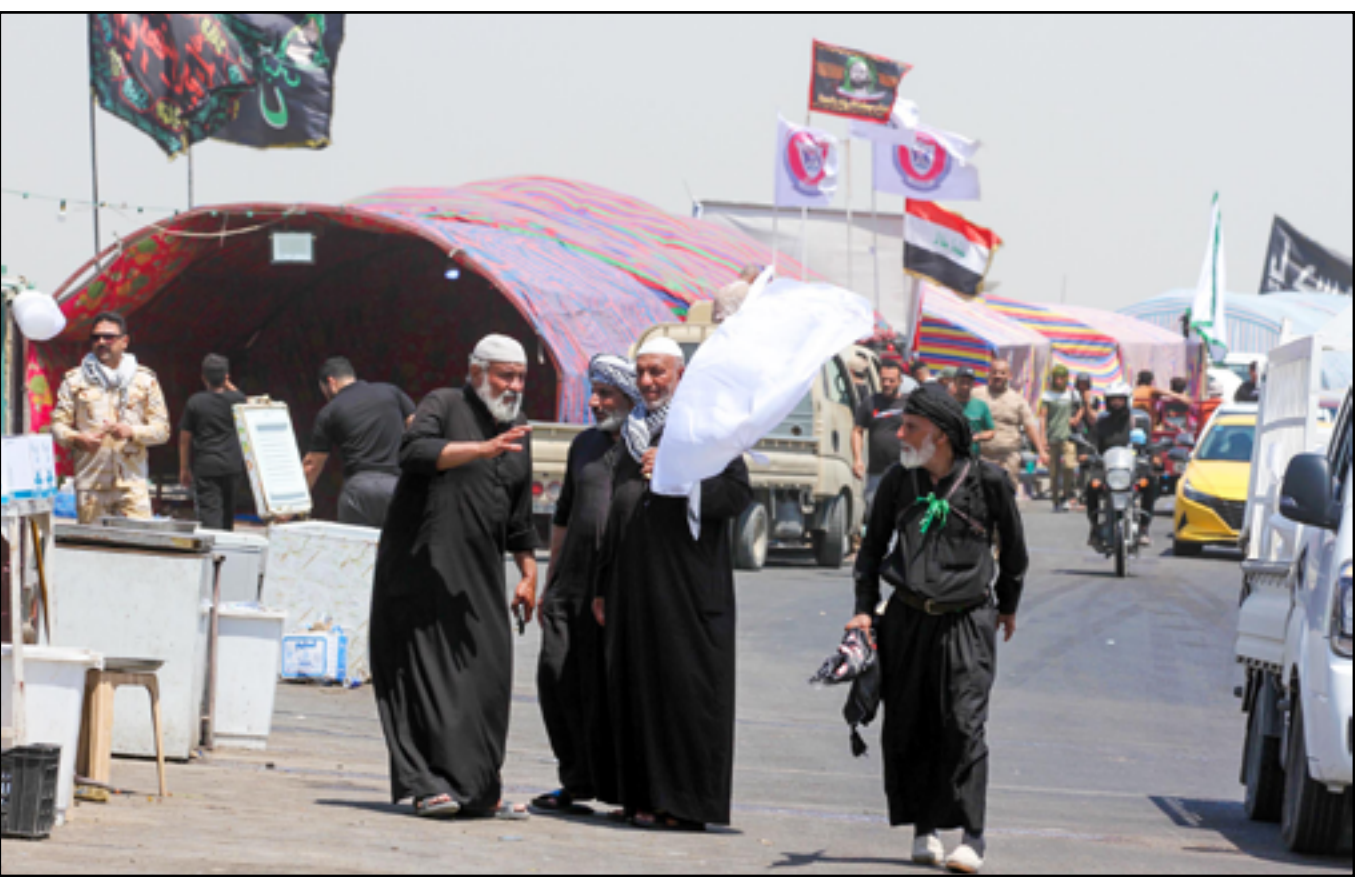
استمرار تدفق زوار أربعينية الإمام الحسين(ع)..