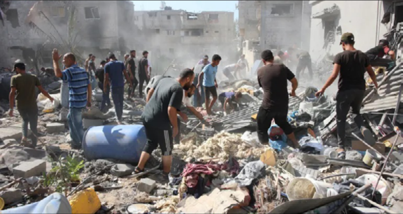
منظلمات إغاثة حذرت مراراً من أن عملية إجلاء واسعة النطاق لسكان مدينة غزة ستفاقم الوضع الإنساني الكارثي، بعدما أكدت

غارقة في المجاعة. وقد نزح الفلسطينيون مرات عديدة خلال الحرب المستمرة منذ ما يقارب العامين، وكثير منهم أصبحوا ضعفاء إلى حد لا يمكنهم معه الانتقال، فضلاً عن أنهم لا يجدون مكاناً يذهبون إليه. وكان الجيش الإسرائيلي قد حدد منطقة المواسي، وهو مخيم عشوائي من الخيام في جنوب القطاع، على أنها منطقة آمنة، ودعا جميع سكان مدينة غزة إلى مغادرتها والذهاب إلى هناك. لكن أولغا تشيريفكوف، المتحدثة باسم مكتب الأمم المتحدة لتنسيق الشؤون الإنسانية، أوضحت أن إعلان «منطقة إنسانية آمنة» في جنوب غزة تم بشكل أحادي من قبل السلطات الإسرائيلية، مؤكدة أن الأمم المتحدة والمجتمع الإنساني الأوسع ليسوا جزءاً من هذا الموضوع. وزارة الصحة في غزة ذكرت أن القوات الإسرائيلية استهدفت خلال الحرب مناطق سبق أن أعلنتها إسرائيل «مناطق إنسانية آمنة، بما في ذلك منطقة المواسي نفسها.