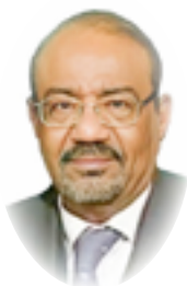
نبيل عبد الفتاح

المحصل اللغوى لدى الأجيال الرقمية أو الفعلية في السياسة، والأمن، والجرائم، والغشاح، وأخبار المطريات والمطربين، والممثلين والممثلات، وباتت جزءاً أساسياً من الصور والمنشورات والتغريدات والإثارة والفشاح من نظام الري، إلى صورهم، وصادقاتهم، وزواجهم وطلاقهم، وحفلاتهم، وتعليقاتهم على بعضهم بعضاً، أو في أبدأ دعمهم للحكومات وللحكام... إلخ. بعض هذه اللغة تسعى إلى أن تكون " تريندات " على وسائل التواصل الاجتماعي، وسعيًا وراء الشهرة، والذئوع، أو استعدادتها بعد أن أفلت وحل محلها آخرين، نظرًا لتراجع الإنتاج الفني في السينما، والدراما التلفازية التي أدت إلى بطالة بعض الفنانين الكبار في السن، أو تغير الأنواع، ونمط الاستهلاك السينمائي والدرامي والمسرحي، والغنائي.