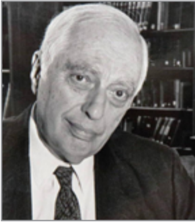
المؤرخ برنارد لويس

كما قرأت له بعد ذلك كتابه عن الإسلام والغرب Islam and the West، الذي يبين العلاقة بين الإسلام والحضارة الغربية، والذي قسم إلى ثلاثة أقسام. القسم الأول يبحث التاريخ